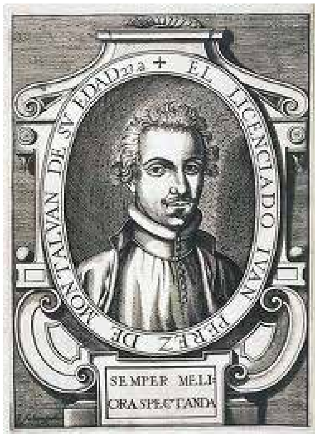
Juan Pérez de Montalván