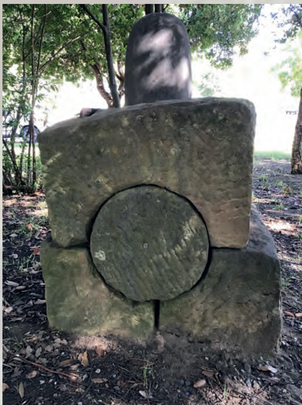
Elementos dentro de la rotonda dedicada al Templo del Sol en Algeciras.

De todos modos, en numerosas ocasiones son las propias señales de tráfico las que cobran protagonismo y, a veces, dificultan u ocultan la visión del objeto, escultura o instalación existente en la glorieta.