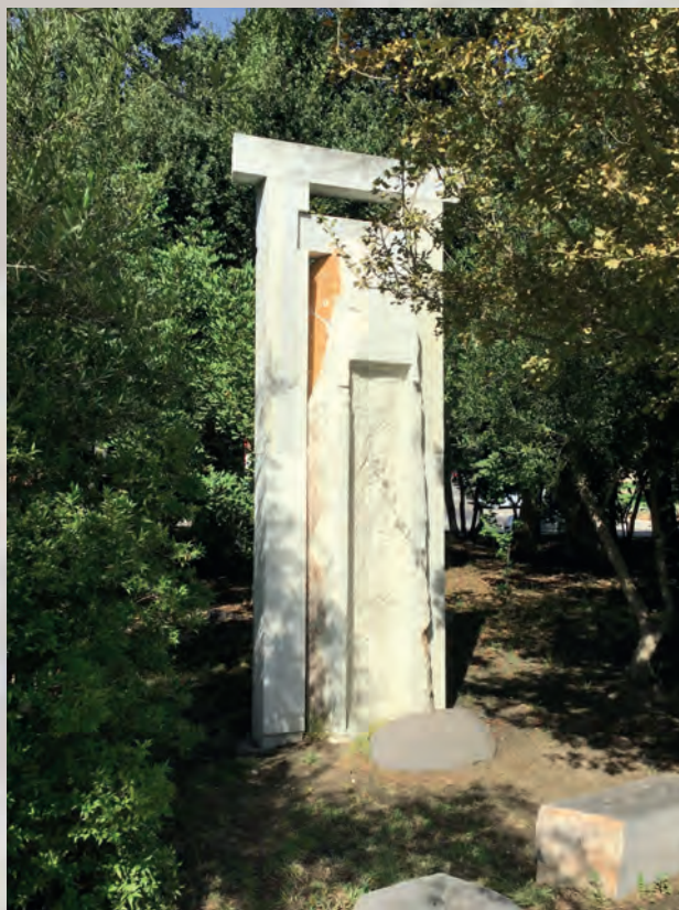
Elementos dentro de la rotonda dedicada al Templo del Sol en Algeciras.

dos, unidos a un extraordinario manejo de diseños, técnicas y acabados, todo este elenco, merecen ocupar un lugar destacado en las páginas de la creación artística.