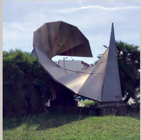
Escultura en la rotonda de la Reconquista, Algeciras.

de las investigaciones técnicas, el manejo de materiales, sopor-tes y prácticas de las disciplinas habituales en cualquier obra de arte. Al igual que tampoco concurren en ellas los discursos y desarrollos narrativos y expresivos del resto de obras de arte que se generan en la actualidad, al encontrarse fuera de los circuitos habituales, como pueden ser galerías, museos, publicaciones, exposiciones, muestras, concursos, etc.