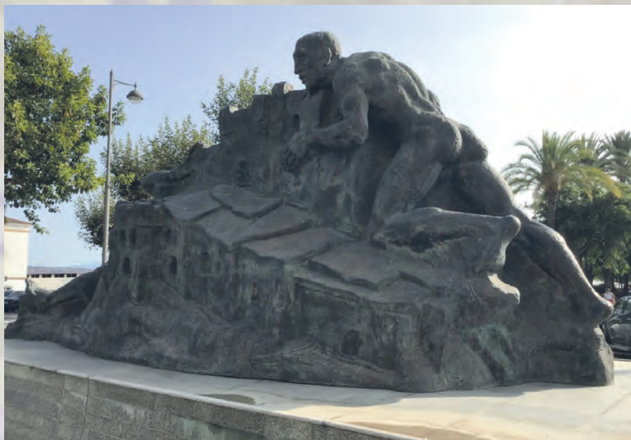
Conmemorando el tercer centenario de la fundación de San Roque. Imagen de las autoras

Pero no sólo son los valores o criterios estéticos de los dirigentes de nuestras ciudades, también la ciudadanía participa, en ocasiones, menospreciando algunas obras. Así tenemos que la escultura próxima al campo de fútbol de La Línea es conocida como el mejillón, o la que se instala en la rotonda de la Reconquista, como el mojón de Mazinger. Quizá el caso más grave ha sido el que ha sufrido la extraordinaria escultura de Sergio Galea en Torreguadiaro que, con el título de Innocence, representa a una mujer-fuente, ya que el agua mana de sus manos.