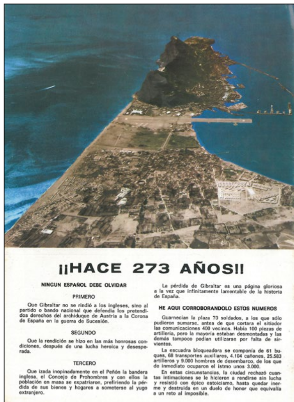
Lámina 6. La cuestión de Gibraltar siempre estuvo presente en la revista Carteya

pasa por un mejor conocimiento del tema en todas sus vertientes. [...] Y no debe quedar la menor duda de que el talante nacional es tan firme señalando la calificación de PACÍFICA, como marcando el objetivo de REINTEGRACIÓN. (Lámina 6)