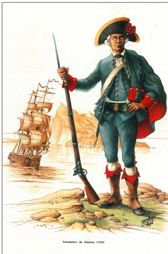
Lámina 4. Escopetero de Getares (1783), ilustración de Carlos Bartual (AHMSR)

Granada, el texto es de Alfonso de Carlos y la contraportada es una ilustración a color del militar de carrera Delfín Manuel Salas Carmena, que firmaba como “Salas”, considerado como uno de los mejores dibujantes de esta temática. A partir del número 3 las ilustraciones son de Carlos Bartual Díaz (Lámina 4), que firmaba como “Carlos” o “Carlos B.”. Carlos Bartual colaboró en revistas como Historia Militar , Maqueta , Defensa o Actualidad española . Su trabajo se desarrolló en el Servicio Histórico Militar del Ejército. También hemos localizado otras ilustraciones militares firmadas por V. A. Por último, no podemos dejar en el tintero las fotografías captadas por las cámaras de Ángel Febrero, Sprint, M. Pérez, Pablo Martínez o Segura; además de algunas viñetas, como la de MACARTU dedicada a Gibraltar que aparece en la edición de febrero de 1976.