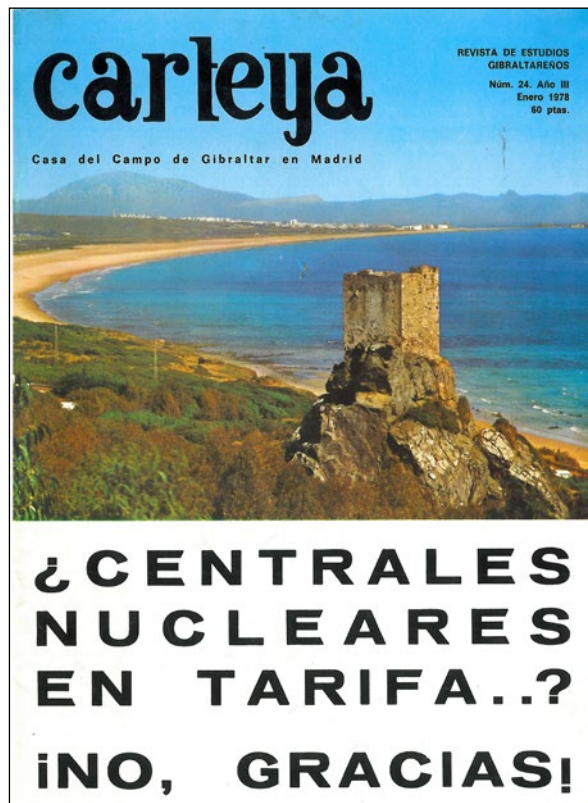
Lámina 8. Portada de la revista Carteya en contra de la instalación de las centrales nucleares en Tarifa