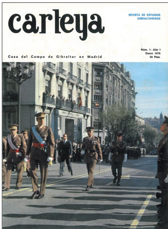
Lámina 5. Portada del primer número de la revista Carteya

geográficas y proyecciones históricas. Es crisol de culturas y convergencia de caminos. Es foco de atracción y de convivencia, desde los llanos de Guadiaro a los riscos de Bolonia. CARTEYA es raíz profunda de nuestra historia, solar de heroicas lealtades y basamento de futuro.