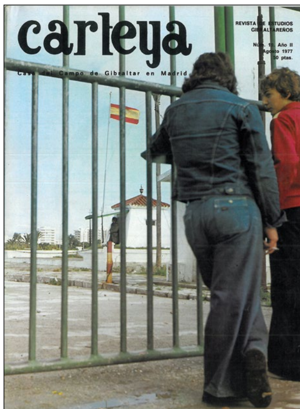
Lámina 2. Portada de la revista Carteya de agosto de 1977.