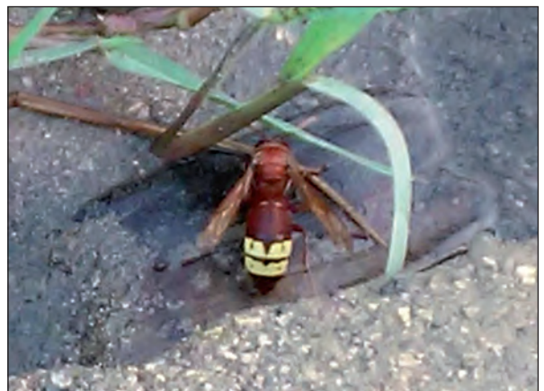
Lámina 5. Avispón oriental tomando tierra mojada para la construcción de su nido.