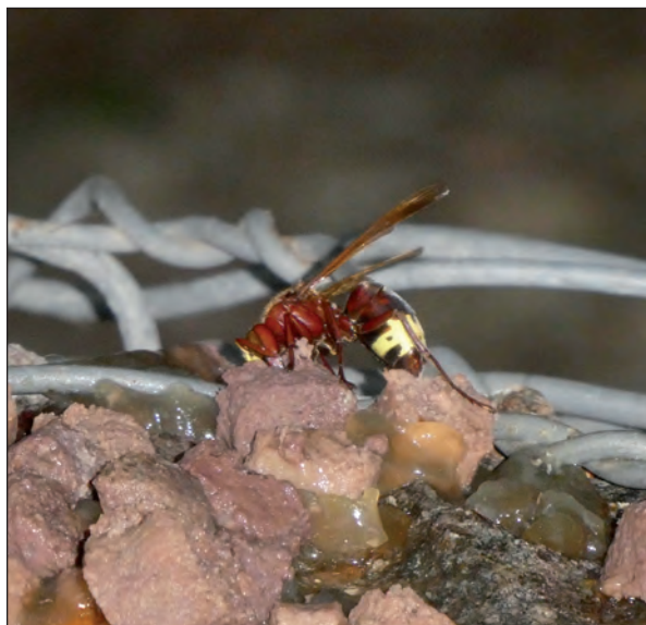
Lámina 4. Avispón oriental ingiriendo comida de gatos.