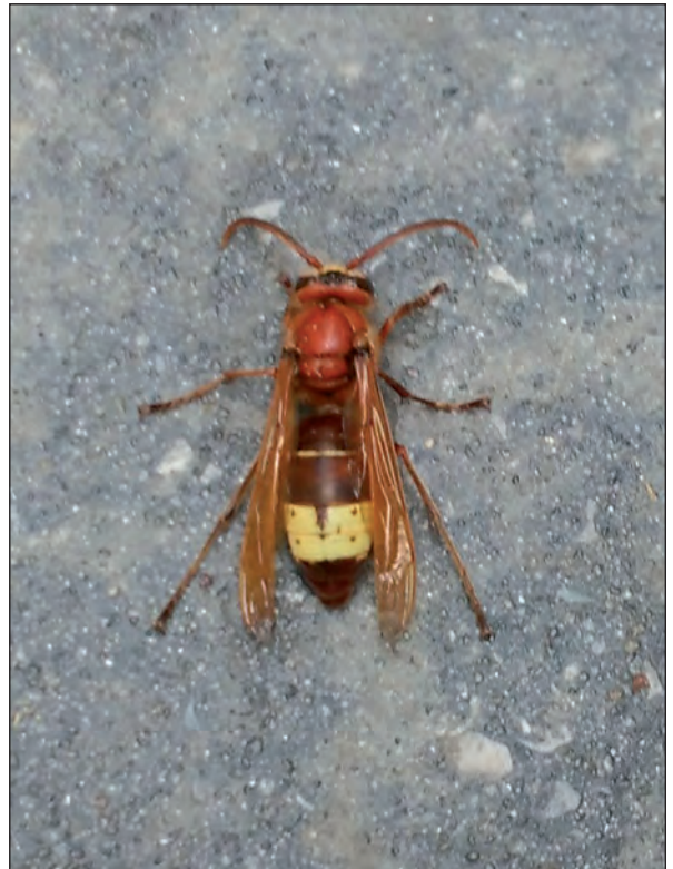
Lámina 3. Vespa orientalis . Imagen de M a del Carmen Fajardo