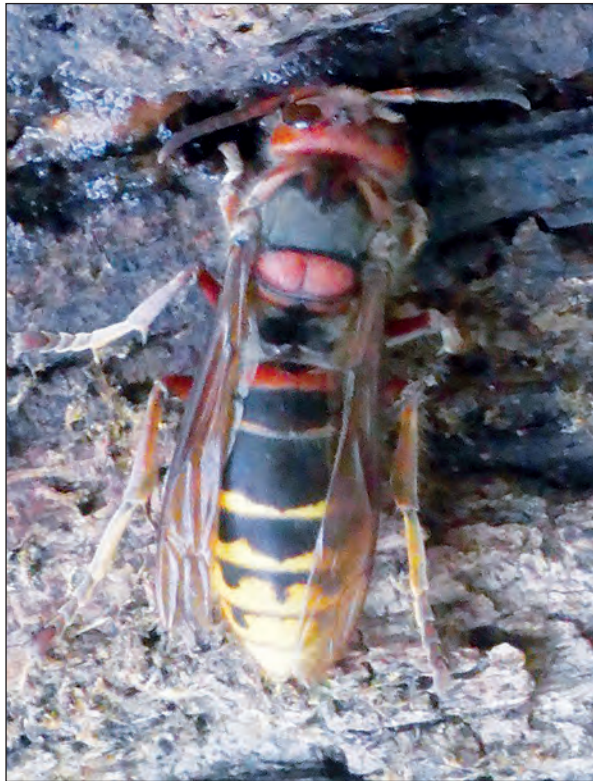
Lámina 2. Vespa crabro . Imagen de M a del Carmen Fajardo