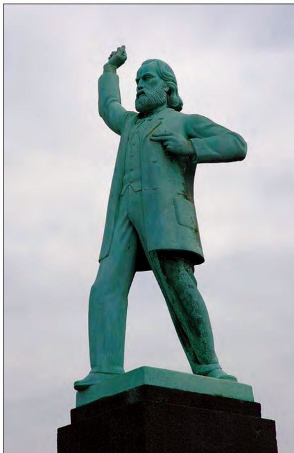
Lámina 2. Estatua de Ferdinand Domela Nieuwenhuis en Nassauplein, Amsterdam