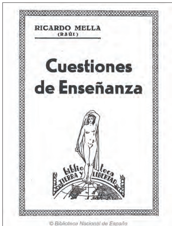
Lámina 4. Cuestiones de Enseñanza de Ricardo Mella