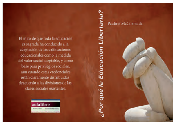
Lámina 5. ¿Por qué de la Educación Libertaria? de Pauline McCormack

La reacción en la revolución. Artículo publicado en la revista Acracia de Barcelona.