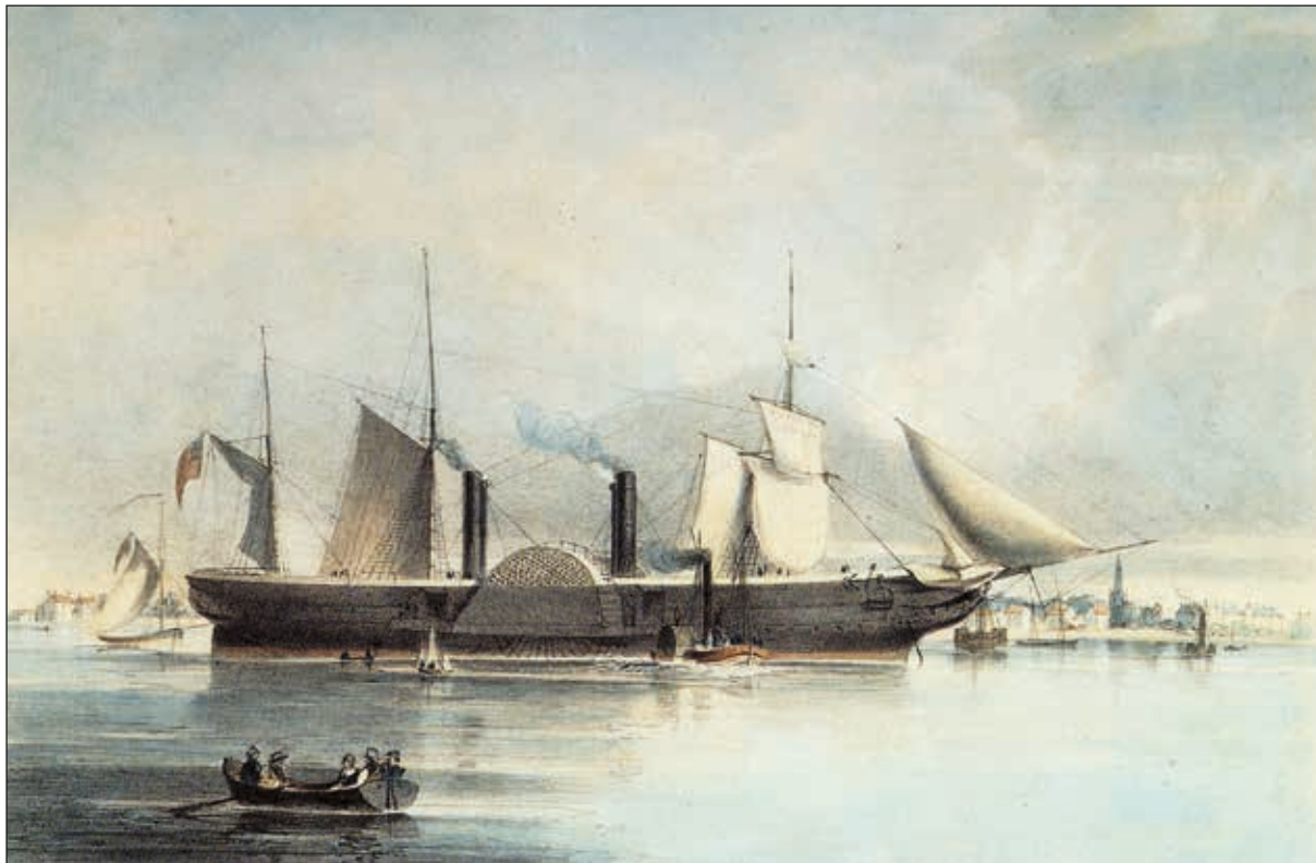
Lámina 3. El S.S. Great Liverpool, hundido en aguas españolas en 1846.

de 7 nudos. Sus dimensiones eran: eslora de 45, 22 m; manga de 7,31 m; y puntal de 4,94 m. Transportaba 21 toneladas de fruta y 21 toneladas en lingotes de plomo con más de 20.000 libras en efectivo. Llevaba en el momento del naufragio 14 pasajeros. Se desconoce el número exacto de la tripulación y su Capitán era J.R. Engledue. Víctimas mortales: 4 ( The Gibraltar Chronicle , 15-16/09/1837).