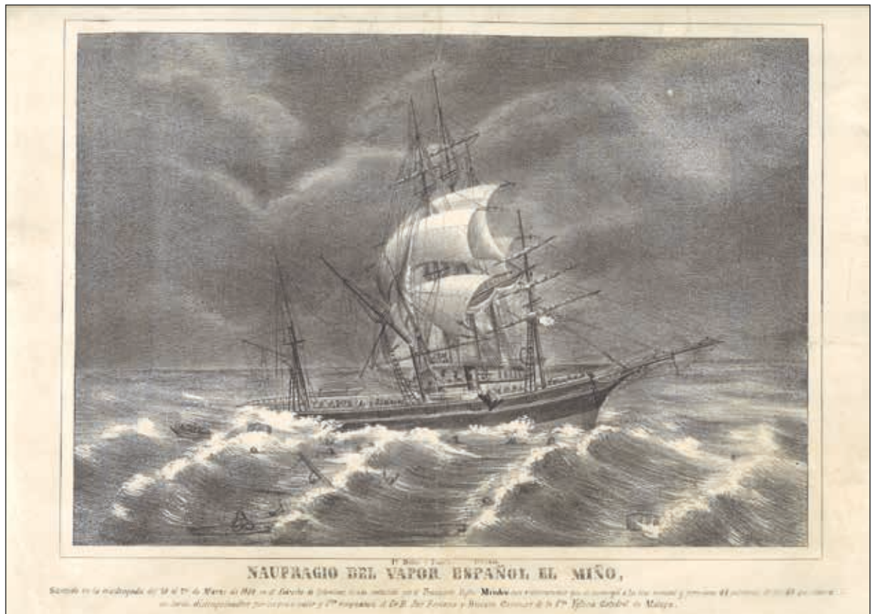
Lámina 4. Litografía del vapor Miño embestido por el Mindem. Siglo XIX. Museo Marítimo de Barcelona

describiendo cómo los pasajeros morían entre el espumeante batir de sus grandes paletas laterales —paletas inventadas—, ha habido de todo.