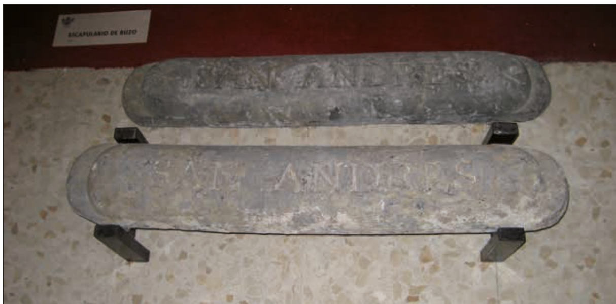
Lámina 2. Lingotes de la fábrica San Andrés.