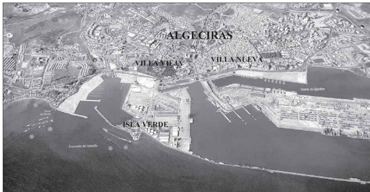
Lámina 3. Puerto de Algeciras.