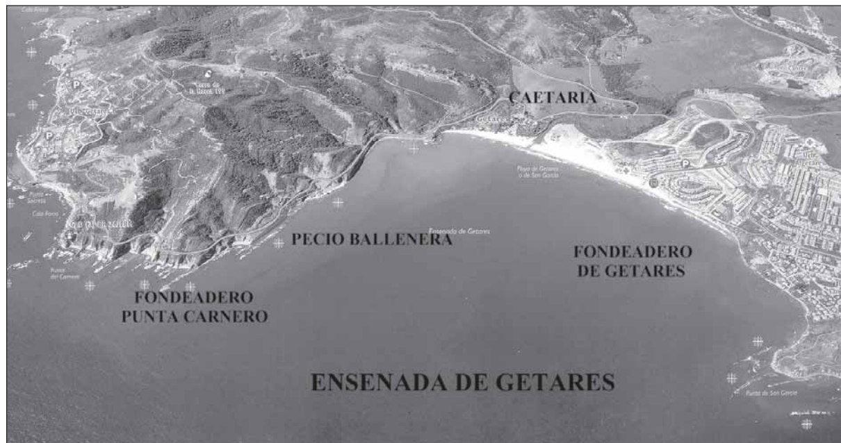
Lámina 2. Ensenada de Getares.