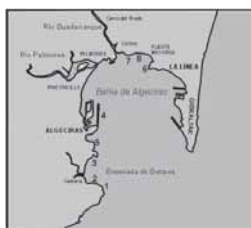
Lámina 1. Plano de la Bahía de Algeciras. 1-8: Zonas donde se ha intervenido arqueológicamente.