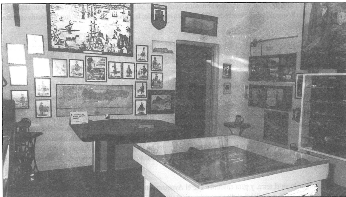
Figura 1. Aspecto de una parte del Museo Costrumbrista del Archivo Histórico Municipal de La Línea.