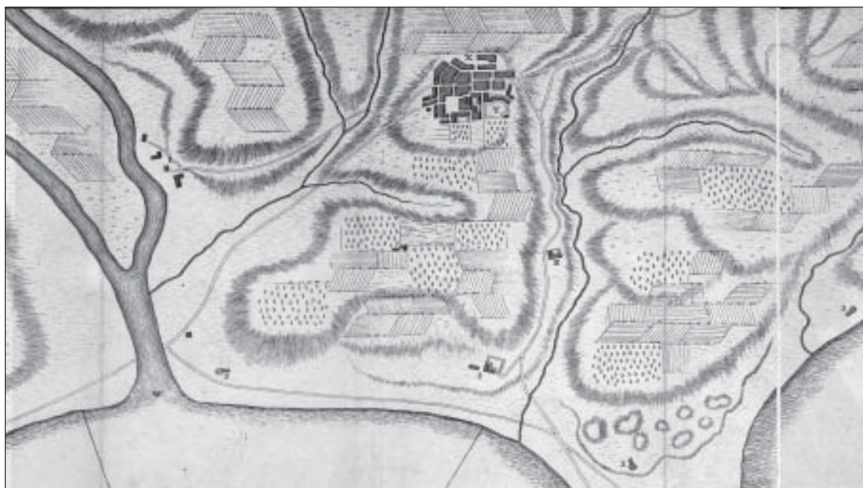
San Roque. British Library, Maps 13.836, Carte de la Baye de Gibraltar Ou l'on voit cette place, avec ses fortifications, celle des Algecires, ses ouvrages projetés, l'Isle qui couvre son port, et le Fortin qui y est projeté, lesquels son Excellence Monsieur le Marquis de Verboom Ingénieur Général traça sur les lieux, comme aussi le Village de St. Roques, où est le camp des Espagnols aujourd'hui. , J. D. Grodemetz, 1722 ?.