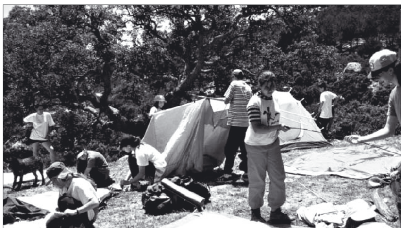
Acampada en La Gloria, Bolonia.

Acampadas. Se realizarán durante las actividades de escalada y posteriormente con la marcha en bicicleta, siendo esta la de más larga duración (3 días), y donde se aplicarán todos los conocimientos que se han ido realizando durante todo el curso, tanto de ámbito deportivo como de adaptación al medio, incluso todo lo referente a la interrelación de las distintas áreas.