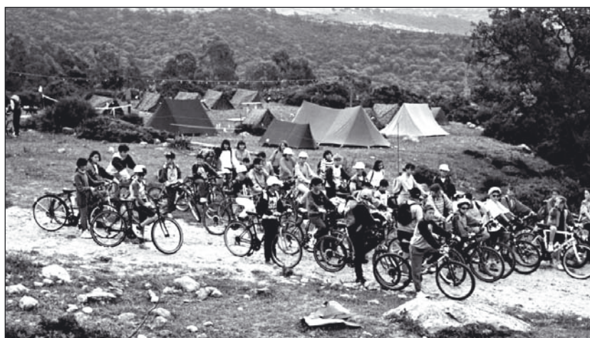
Salida en mountain-bike desde el campamento de La Gloria, Bolonia.

Mountain-Bike. La actividad de mountain-bike, irá acompañada de una serie de actividades, tanto en el tema de educación vial como de habilidades en pista ( gimkanas ).