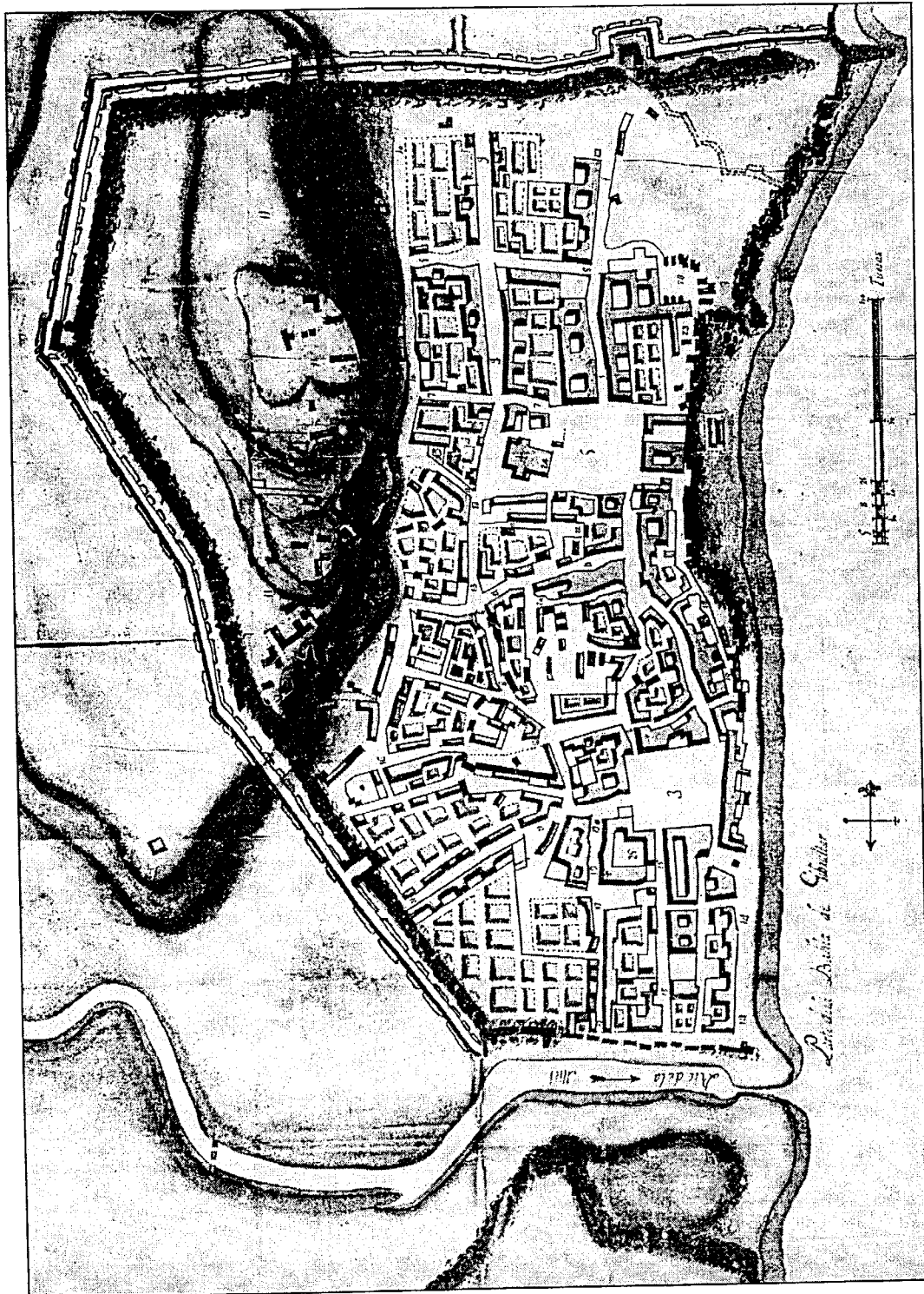
Ilustración 4. La Villa Nueva en 1736. Con el número 23 los "Cuarteles Altos" y con el 8 la "Calle de San Antonio" y con el 8 la "Calle de San Antonio". AGS, G.M., M.P. y D. XIV-36, leg. 3.618. "Plano de los vestigios de la Ciudad principal de las Algeciras y porción de los de la pequeña en que se demuestra el estado de la nueva población como se halla oy día 29 de junio de 1736". Leyenda: 1.- Calle Ymperial. 2.- Calle del Sacramento. 3.- Plaza Vaxa. 4.- Calle de las Carrejas. 5.- Plaza Alta. 6.- Calle Larga. 7.- Calle de Rocha. 8.- Calle de Sn. Antonio. 9.- Calle Archa. 10.- Calle de Sevilla. 11.- Matagorda. 12.- Calle de Xerez. 13.- Calle Alta. 14.- La Marina. 15.- Calle del Rto. 16.- Calle de Sorria. 17.- Calle del Quarrel. 18.- Calle de la Mar. 19.- Calle del Pozo. 20.- Calle de las Damas. 21.- Calle de Tarifa. 22.- Calle de las Viudas. 23.- Cuarteles Altos. 24.- Yglesia nueva. 25.- Cuarteles de Caballería y Ynfantería.