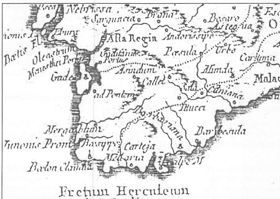
Figura 2. "Hispania Antiqua in tres praecipuas partes se ilicet Tarraconensum, Lusitanian et Baeticum". N. Sanson. París, 1750

sobre las antiguas diócesis de Hispania, no aporta nada sobre la zona (11) , lo mismo que otro sobre Hispania, editado en París hacia 1705.