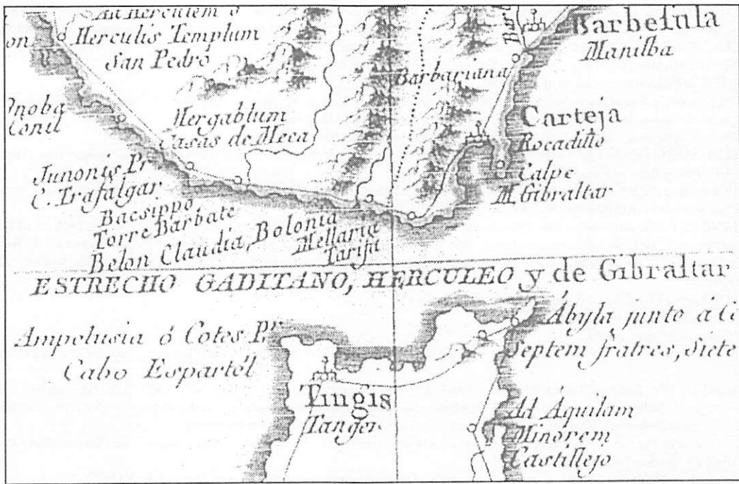
Figura 7. Bética Antigua. Juan López. 1788

Como podemos apreciar la identificación topográfica de los municipios latinos es todavía poco precisa, si bien los puntos que más se repiten en los distintos autores, coinciden con los únicos que hoy día se pueden dar por definitivamente localizados, es decir Calpe en Gibraltar, Carteya en Rocadillo y Baco en Bolonia. En cuanto a las localizaciones de las otras poblaciones, la cartografía no hace más que reflejar los textos de geografía histórica del momento, localizando generalmente a Mellaria en Tarifa o en Getares. La localización de Julia Traducta ofrece una mayor dispersión, identificándose con Bolonia (?), Tarifa, Algeciras, Getares y con un lugar que corresponde aproximadamente con Los Barrios. Portus Albo se localiza en Bolonia (?) y en Algeciras (42) .