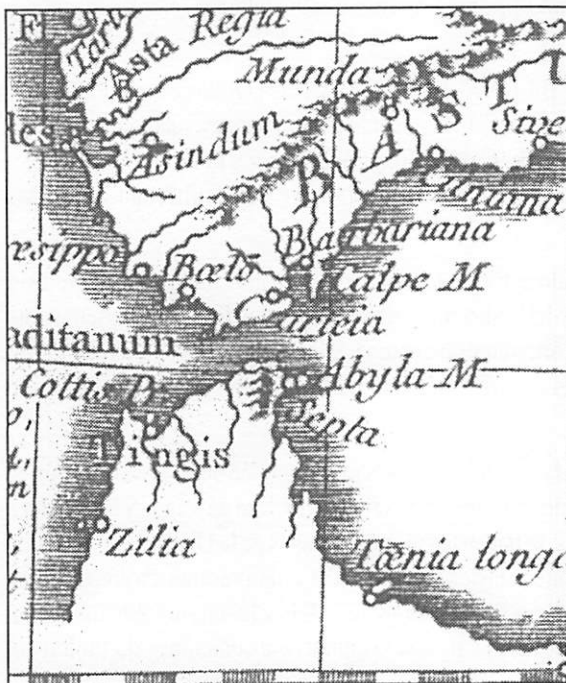
Figura 3. D'Anville 1738. Mapa para la edición de Histoire Romaine , de Rollin.

Este Atlas se compone de siete volúmenes. La primera edición que conocemos es de 1705. En el primer tomo se publica un mapa histórico de España. En el Estrecho de Gibraltar, hacia el Este indica la siguiente leyenda: Retraite des fils de Pompée après la perte de la bataille de Munda et la défaite et la mort de Cneus l'ainé par Didius, lieutenant de Cesar (Retirada de los hijos de Pompeyo después de la pérdida de la batalla de Munda y la derrota y muerte de Cneo el Viejo por Didius, lugarteniente de César). Hacia el Oeste, indica: Heemskerk fameux Amiral d'Hollande, emporte la victoire dans un combat naval contre la flotte d'Espagne en 1607 (Heemskerk famoso almirante de Holanda, llevó la victoria en un combate naval