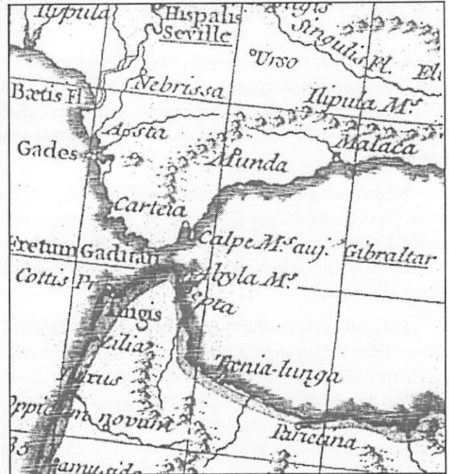
Figura 4. Mapa en el Atlas historique , D'Anville 1745.