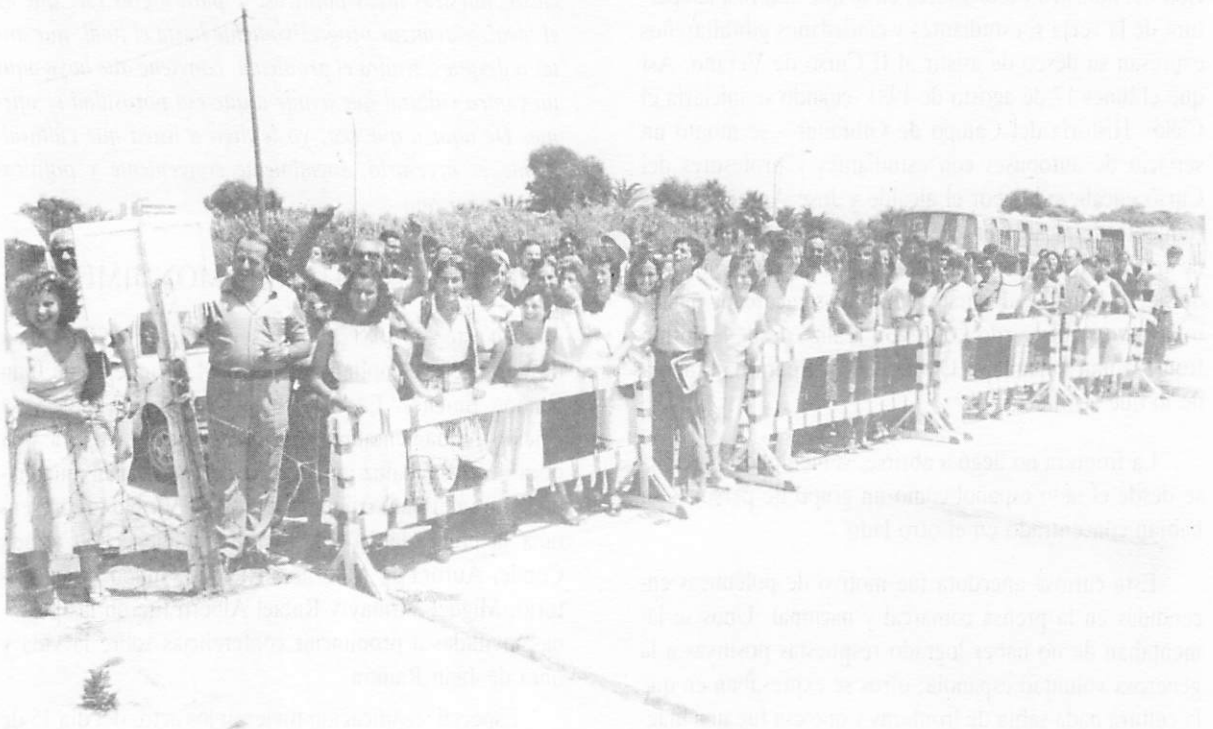
Participantes en el II Curso de Verano ante la frontera con Gibraltar esperando a estudiantes y ciudadanos gibraltareños.