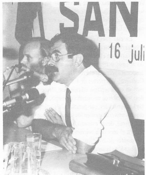
Conferencia del Presidente de la Junta de Andalucía en el V Curso de Verano.