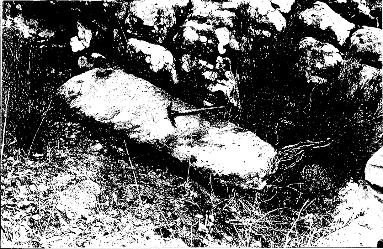
Detalle de la única tapa hallada intacta.