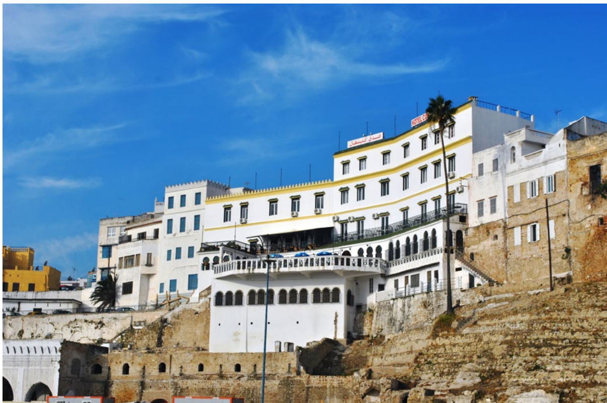
Lámina 9. Hotel Continental. Tánger. Marruecos.

a lo largo de las naves de la Mezquita de Córdoba. Estos marroquíes eran hermanos de nuestros jornaleros españoles; sus mujeres eran hermanas de las andaluzas que, para salir de paseo en Vejer de la Frontera, solo se dejaban ver uno de sus ojos; la guzla es la guitarra y el baile flamenco es el mismo de las moras y hebreas que danzan delante de los cristianos... la malagueña es un cantar similar al que se oye en los cafés de Tánger.