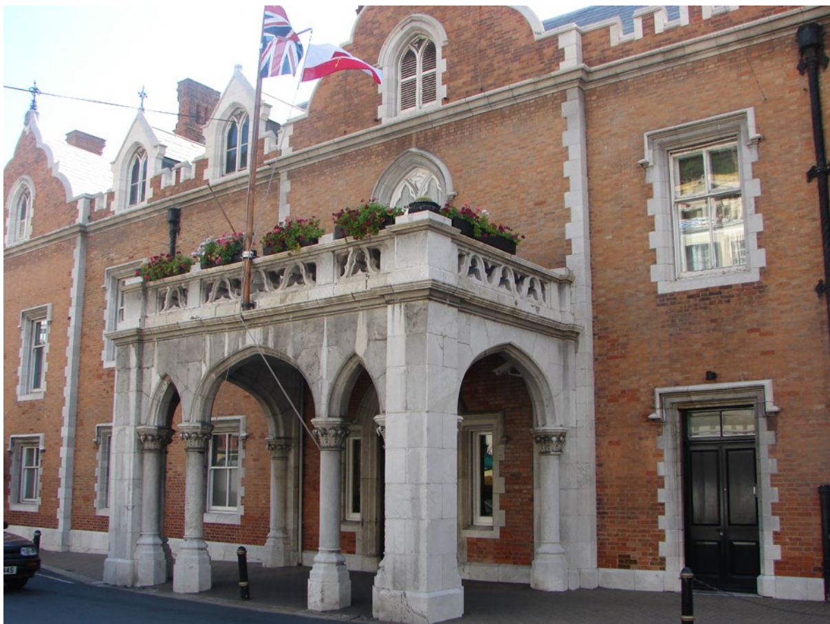
Lámina 4. El Convento. Residencia oficial del Gobernador de Gibraltar

mañana dos y así sucesivamente. En aquella parte de nuestro territorio tan solo es firme el carácter de los ingleses”.