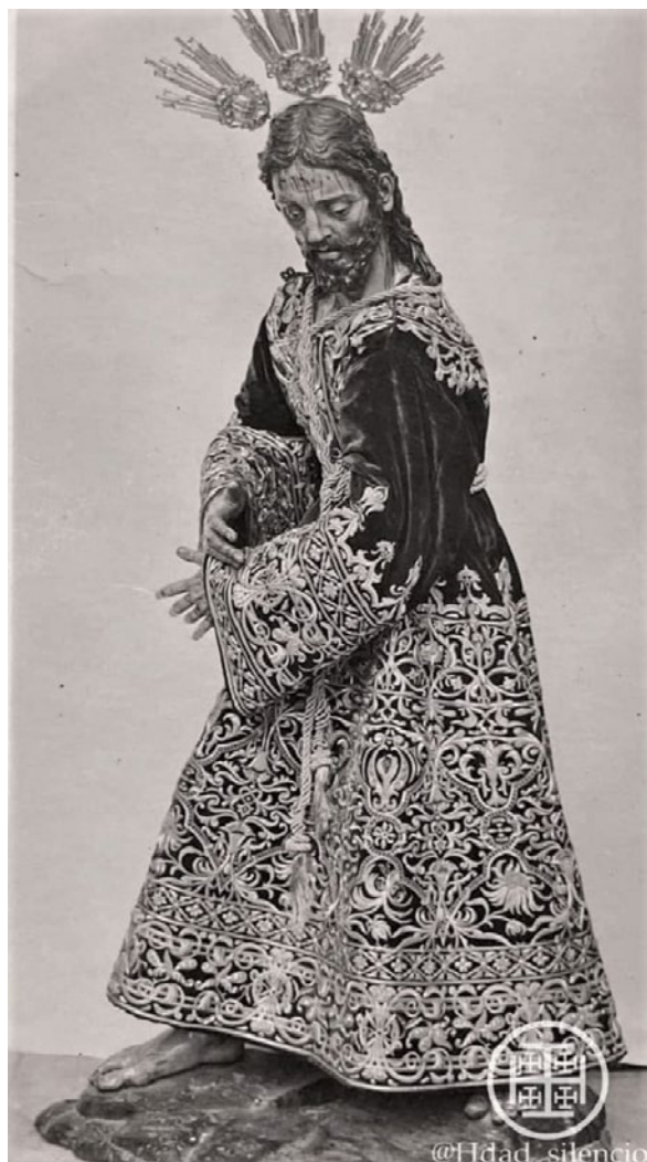
Lámina 2. Jesús Nazareno. Foro de la Hermandad del Silencio (Sevilla)

Después se trasladó a Cádiz y más tarde a la localidad de Algeciras “tierra llena de bravura y de bandidos sueltos”. Llegó un día de primavera en el que reinaba una tremenda tempestad con vientos fuertes de Levante y abundante lluvia y fue obligado, junto al resto de viajeros, a hacer la travesía hasta el Peñón en desvencijados botes, tras haber pagado una importante suma de dinero. Comentaba que tanto los policías de la Aduana como los empleados públicos tenían un aspecto tan feroz, unos modos tan canallescicos, arremetiendo contra aquellos pobres viajeros que iban con las ropas caladas por la lluvia y mareados por la bravura del mar, que llegó a