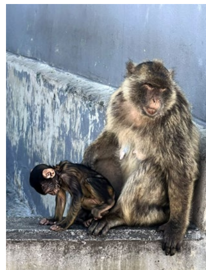
Lámina 6. Macacos de Gibraltar.