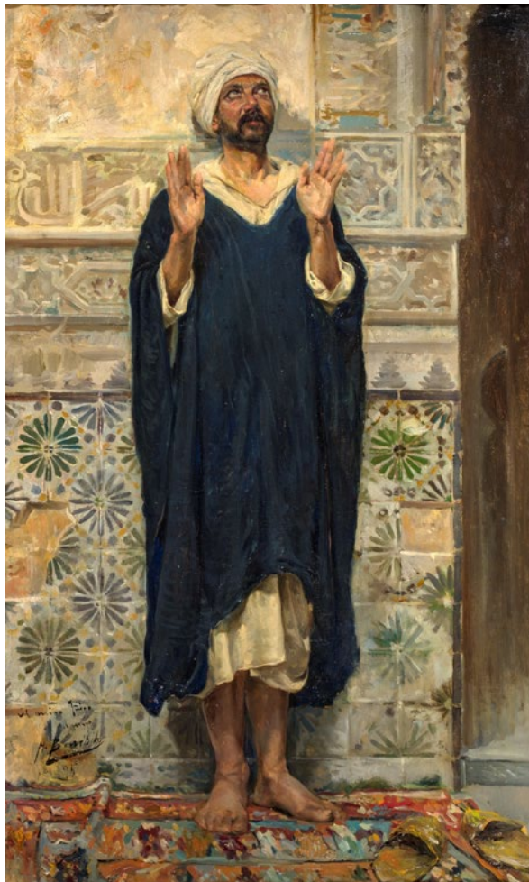
Lámina 10. Moro. M. Benedito y Vives. Museo del Prado

su carácter había cambiado para transformarlo en un ser frágil, extenuado y entristecido. Nos ha dejado grandes enseñanzas de periodismo y unos relatos que en el caso concreto de Gibraltar y Tánger son una auténtica delicia de subjetividad, haciendo alarde de una libertad de prensa inigualable. Como escribió Pío Baroja “en el fondo fue un hombre afortunado ya que vivió en una época en la que se respetaba y consideraba al intelectual de ideas libres, pues en otro momento de la historia habría acabado en la cárcel”.