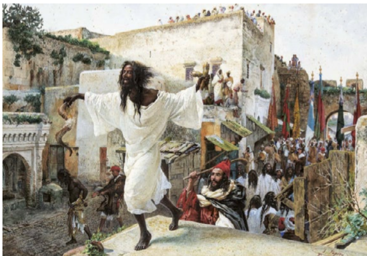
Lamina 7. La fiesta del a Issawa. Tánger 1885. J. Tapiró