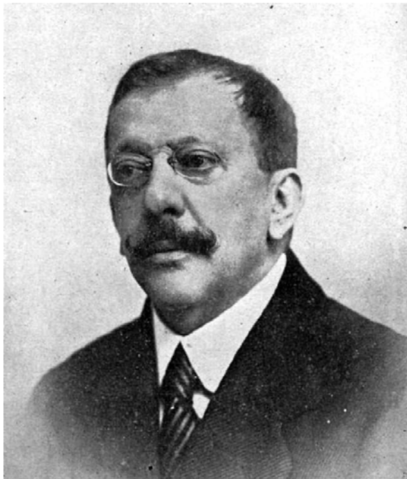
Lámina 3. Luis Bonafoux y Quintero.

de Saint Thomas, 4 aunque esta última tenía más vegetación y menos baterías. Su primera impresión fue que aquella plaza no era un sitio ameno para los turistas, sino que más bien se trataba de una fortaleza siempre dispuesta para el combate. De hecho, cinco mil soldados recorrían diariamente sus calles y las tardes de los sábados hacían simulacros de batallas para regocijo de sus habitantes y para terrible aburrimiento de los foráneos.