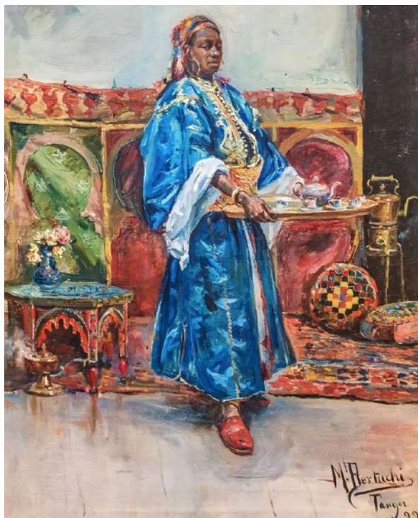
Lámina 8. Sirviendo el té o Serving Tea (Servir le thé). M. Bertuchi, Tánger (Marruecos), 1899.

Entre las muchas singularidades de este pueblo árabe destacaba Bonafoux el modo de sentarse, adoptando actitudes inverosímiles ya que nadie sabría decir al verlos donde se guardaban las piernas; pero sí que se podían sentar en la punta de una aguja. Afirmaba que en una de las múltiples tiendas que poblaban las calles de la medina había observado a un individuo agazapado en un espacio inverosímil por lo reducido del mismo “contemplando impasiblemente cómo se adherían a la manteca que rebosaba de una lata multitud de pelos, sacudidos de una toalla por un oficial de una peluquería española vecina del tenducho. Sobre las raídas cabezas morenas de ellos se pasean grandes piojos blancos”.