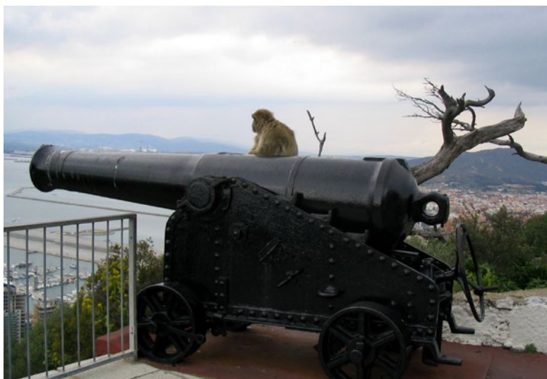
Lámina 5. Mono sobre un cañón en desuso.

Convertida en capital diplomática de Marruecos desde 1786 comenzaron a llegar entonces a la ciudad las distintas legaciones europeas y fueron instalándose a lo largo de la arteria principal de la medina, la calle Es-Siaguine, hoy Monkhtar Ahardan, centro social y económico. En ella, estaba ubicado el consulado de España cuyo representante era