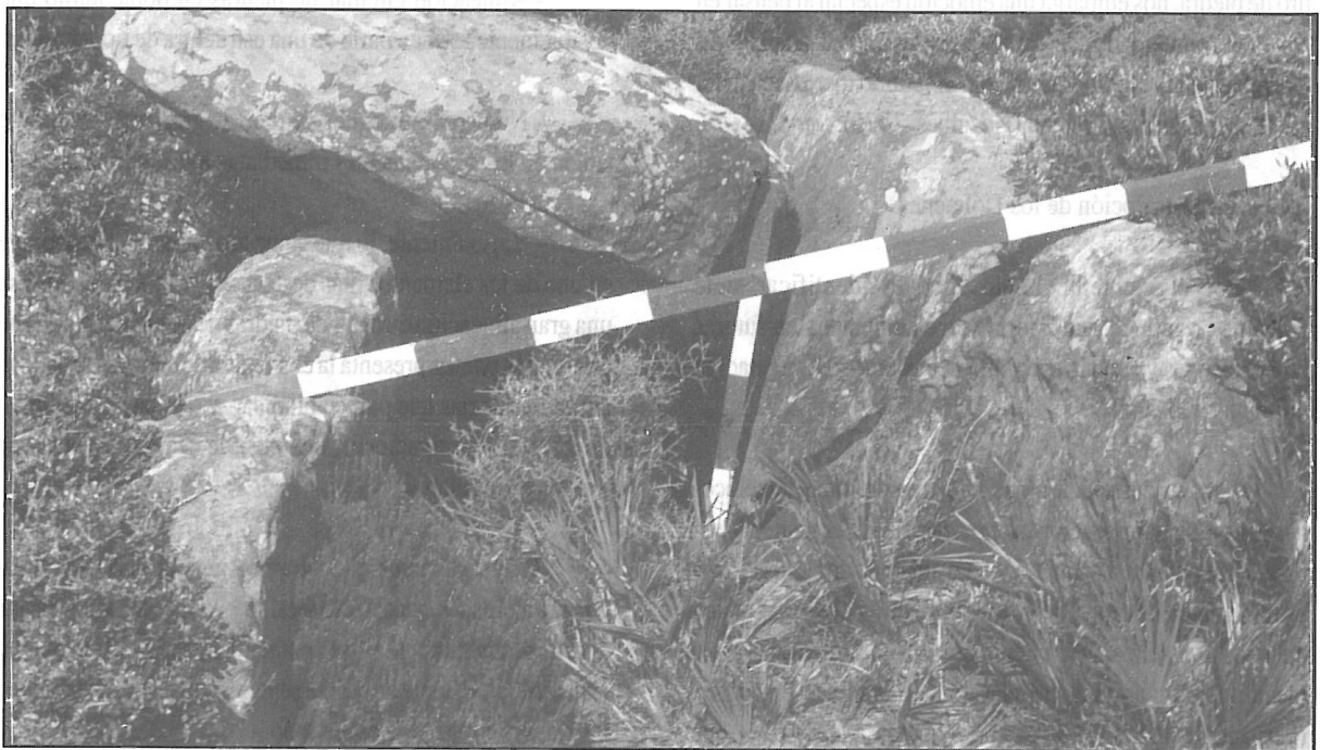
Dolmen n.º 7