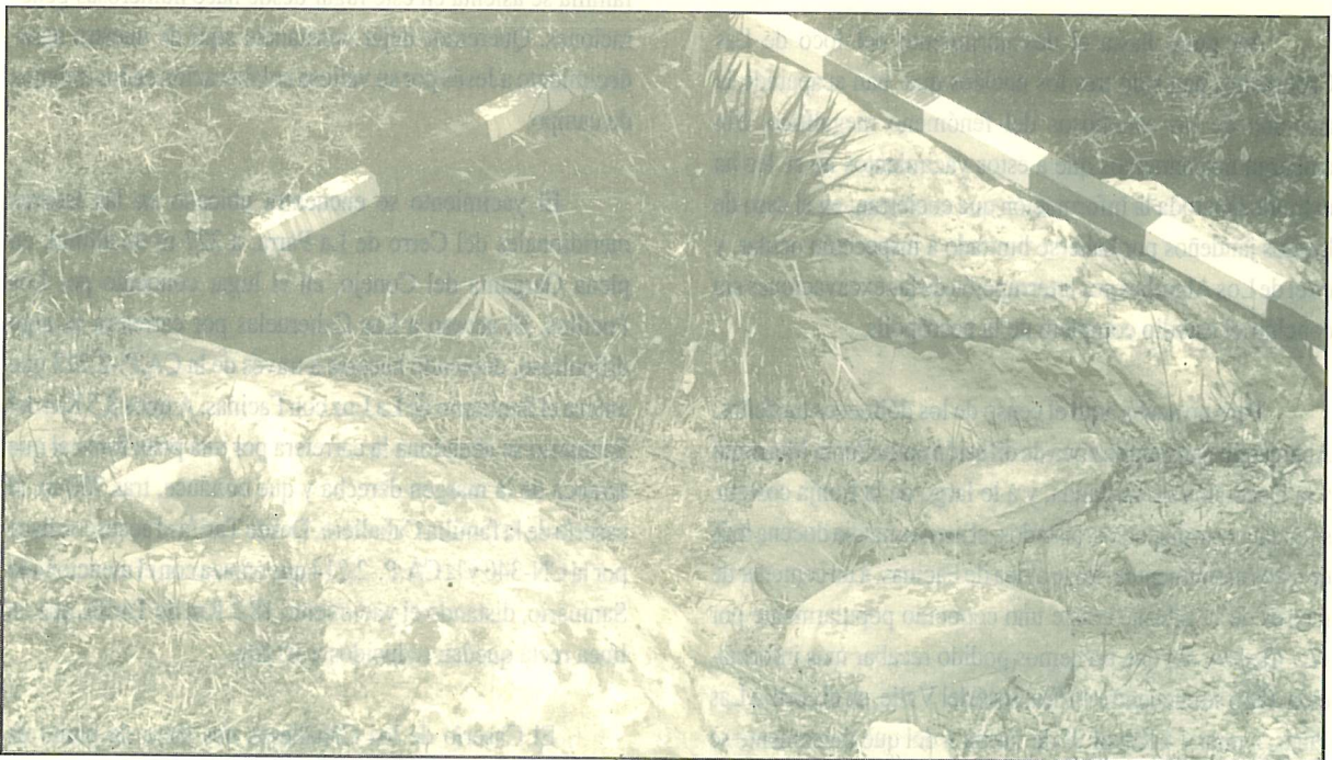
Dolmen n.º 5