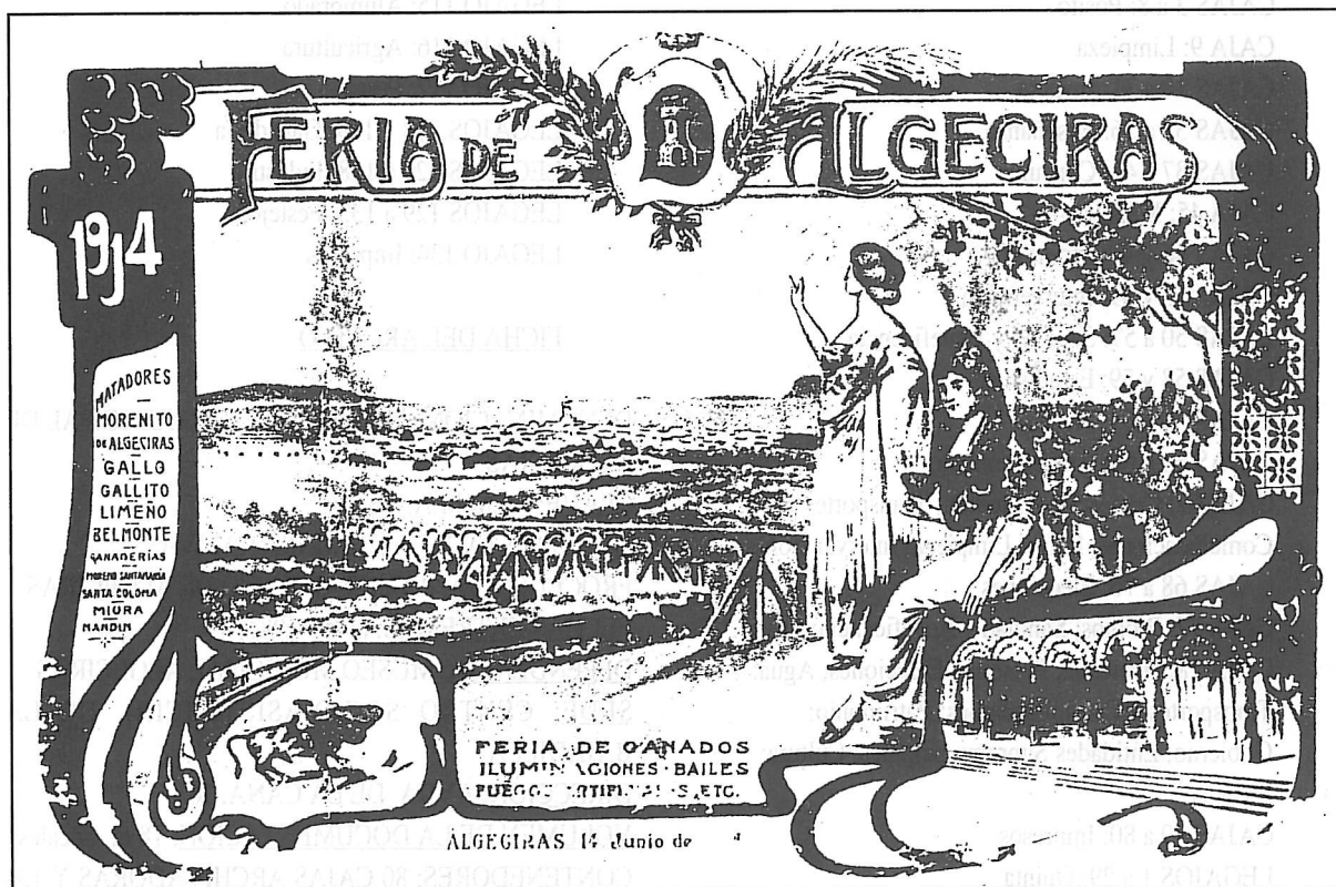
Cartel anunciador de la Feria de 1914, rescatado entre la documentación y restaurado, sirvió para anunciar la Feria de 1985.

CAJA 78: Exp. 11. Libro de salida de correspondencia de la Jefatura Civil de Algeciras del Gobierno Civil de Cádiz