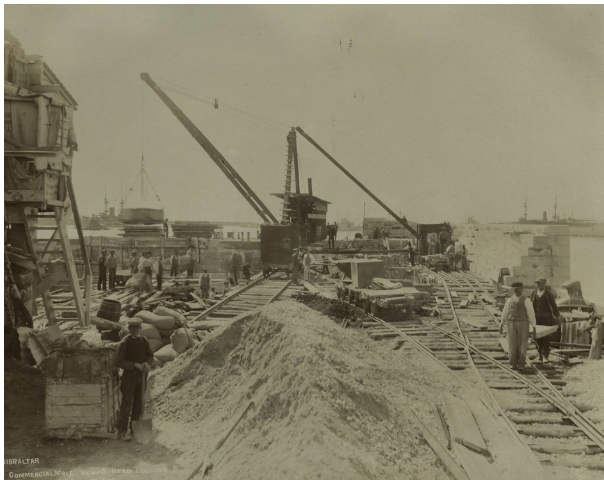
Lámina 1. Commercial Mole View of South Head looking South 26-03-1904.