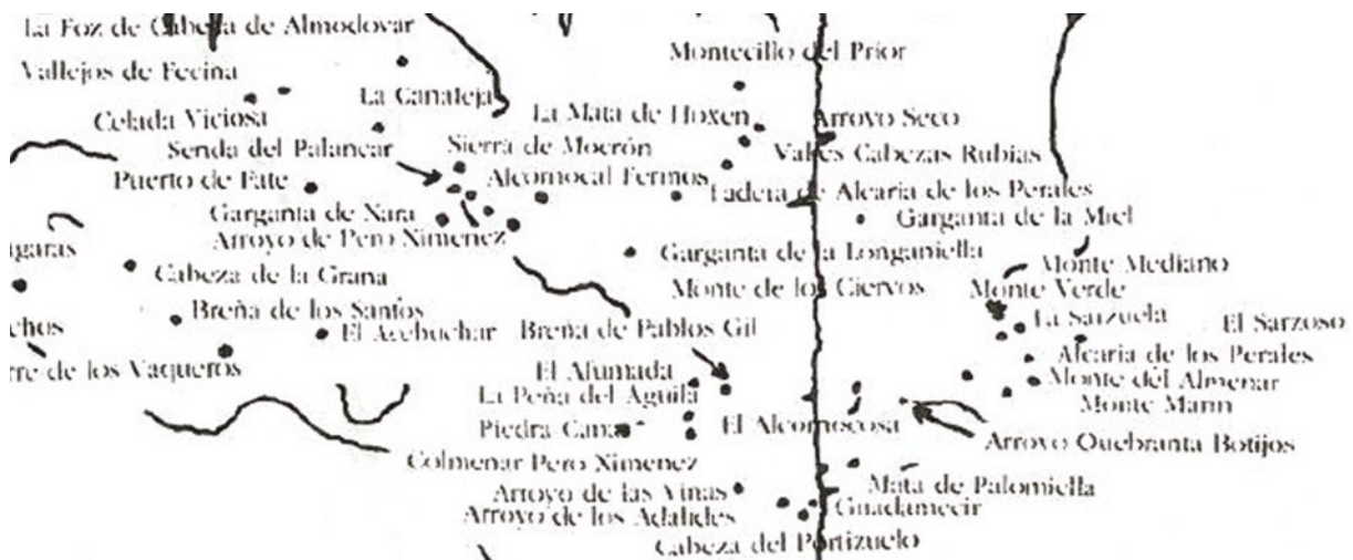
LÁMINA 2.- Ubicación de algunos de los cazaderos que el Libro de la Montería de Alfonso XI describe en el actual Campo de Gibraltar.

Curiosamente, la toponimia castellana citada en el texto venatorio se reparte y conserva en todas las tierras algecireñas, pero se concentra de manera llamativa en el valle del río Palmones, especialmente en el entorno geográfico de la