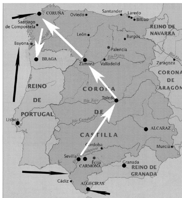
LÁMINA 1.- Itinerarios de los movimientos militares del año 1369. Con fechas blancas los del rey de Castilla, Enrique II; con flechas negras los de portugueses y granadinos. Elaboración del autor