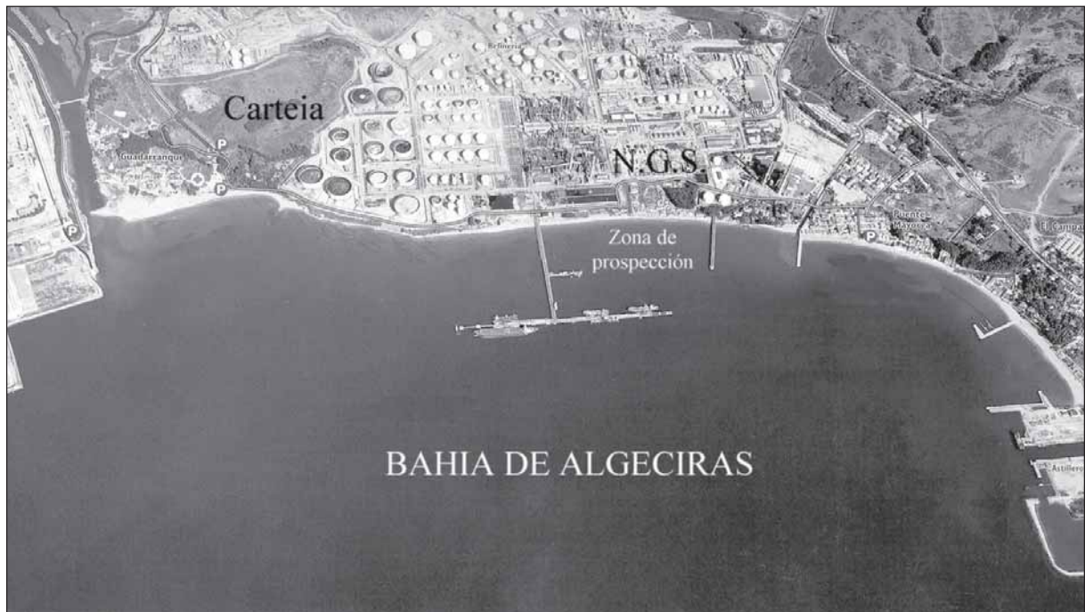
Lámina 1. Plano de localización.

Por todo ello se vio necesario por parte del Equipo de Seguimiento la realización de una intervención más intensiva y sistemática en el área afectada, con el objetivo de comprobar la extensión del material en la zona, definir el estrato continente del material arqueológico y el definir el origen de los sillares localizados.