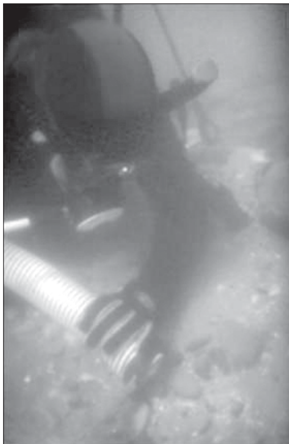
Lámina 2. Sondeos con manga de succión.

Se documentó abundante material cerámico de adscripción cronológica bastante homogénea (un alto porcentaje de material romano), y de tipología muy en consonancia con la de un sitio portuario o de fondeadero (abundantes restos anfóricos y pesas de red). También se localizó material diverso de época romana aunque en menor porcentaje con respecto a los contenedores de gran tamaño (jarritas, platos, cuencos, terra sigillata , etc).