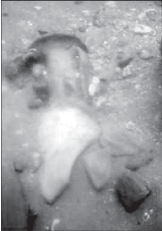
Lámina IV. Detalle restos localizados en prospección: Ánfora Beltrán IIB.

Los restos de época medieval, moderna y contemporánea no son muy significativos en proporción con la época antigua.