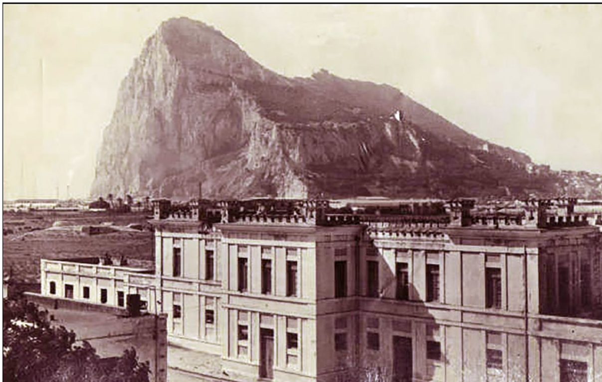
Lámina 7. El acuartelamiento General Ballesteros de La Línea de la Concepción con el peñón de Gibraltar al fondo.

directrices de sus superiores en el Alto Estado Mayor 33 o, por el contrario, sólo se trató de una iniciativa personal suya, acometida a espaldas de sus superiores, alimentada por sus profundos sentimientos antibritánicos y favorecida por su anterior relación con los servicios secretos alemanes, sea como fuere, no cabe duda de que los hechos que componen la trayectoria profesional y personal del coronel Sánchez-Rubio, en su paso por el Campo de Gibraltar, constituyen una de las mejores manifestaciones, tanto del verdadero significado de la no-beligerancia española, como de las consecuencias de la vuelta a la neutralidad con la que se le puso término. El coronel Eleuterio Sánchez-Rubio y Dávila falleció en Sevilla el 21 de noviembre de 1972 y está enterrado en el cementerio de San Fernando de la capital andaluza.