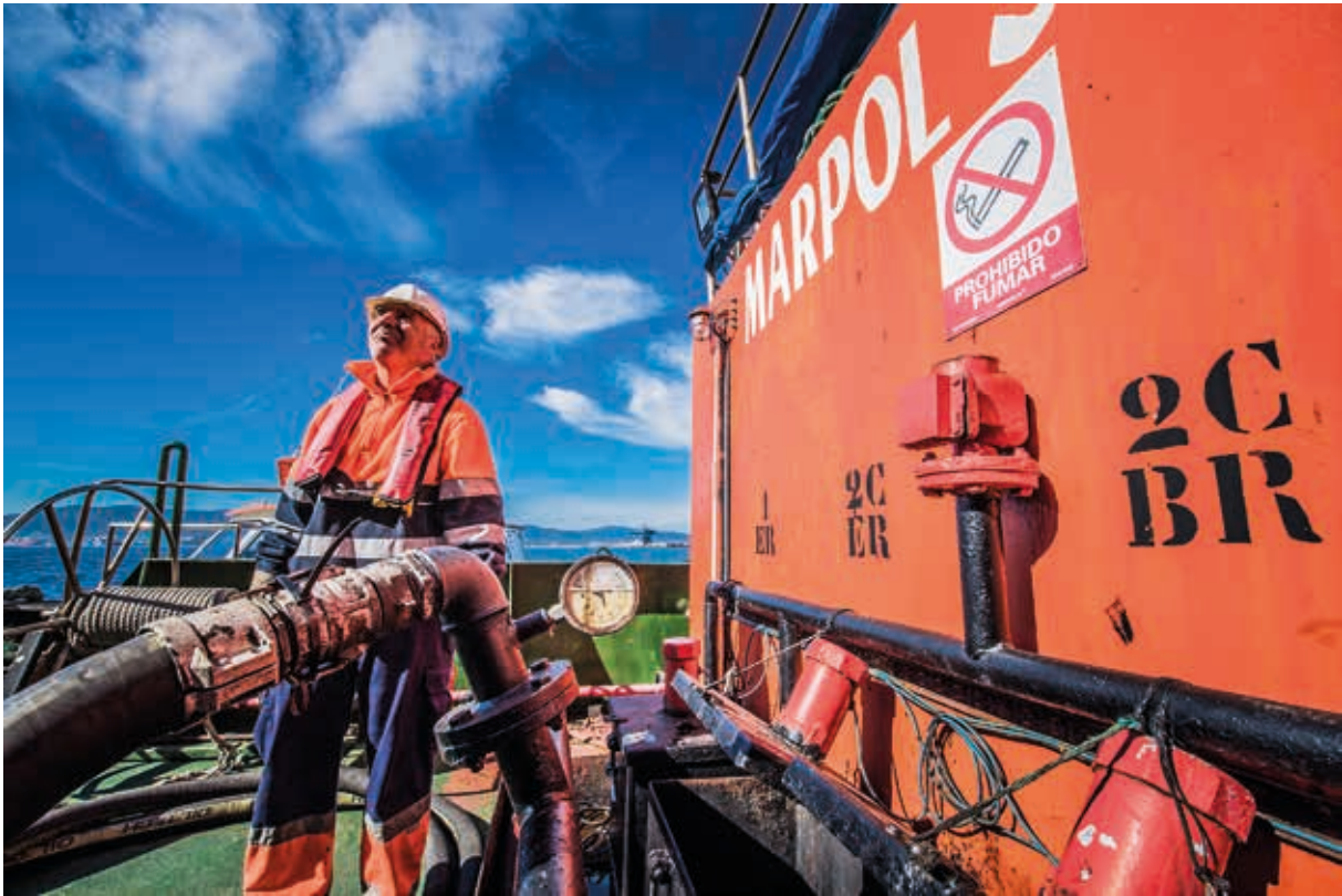
La transfusión. 30-10-2019