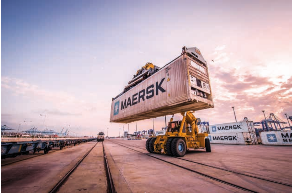
Cargador del Alba. 01-06-2017

Almoraima. Revista de Estudios Campogibaltareños. Volumen 54