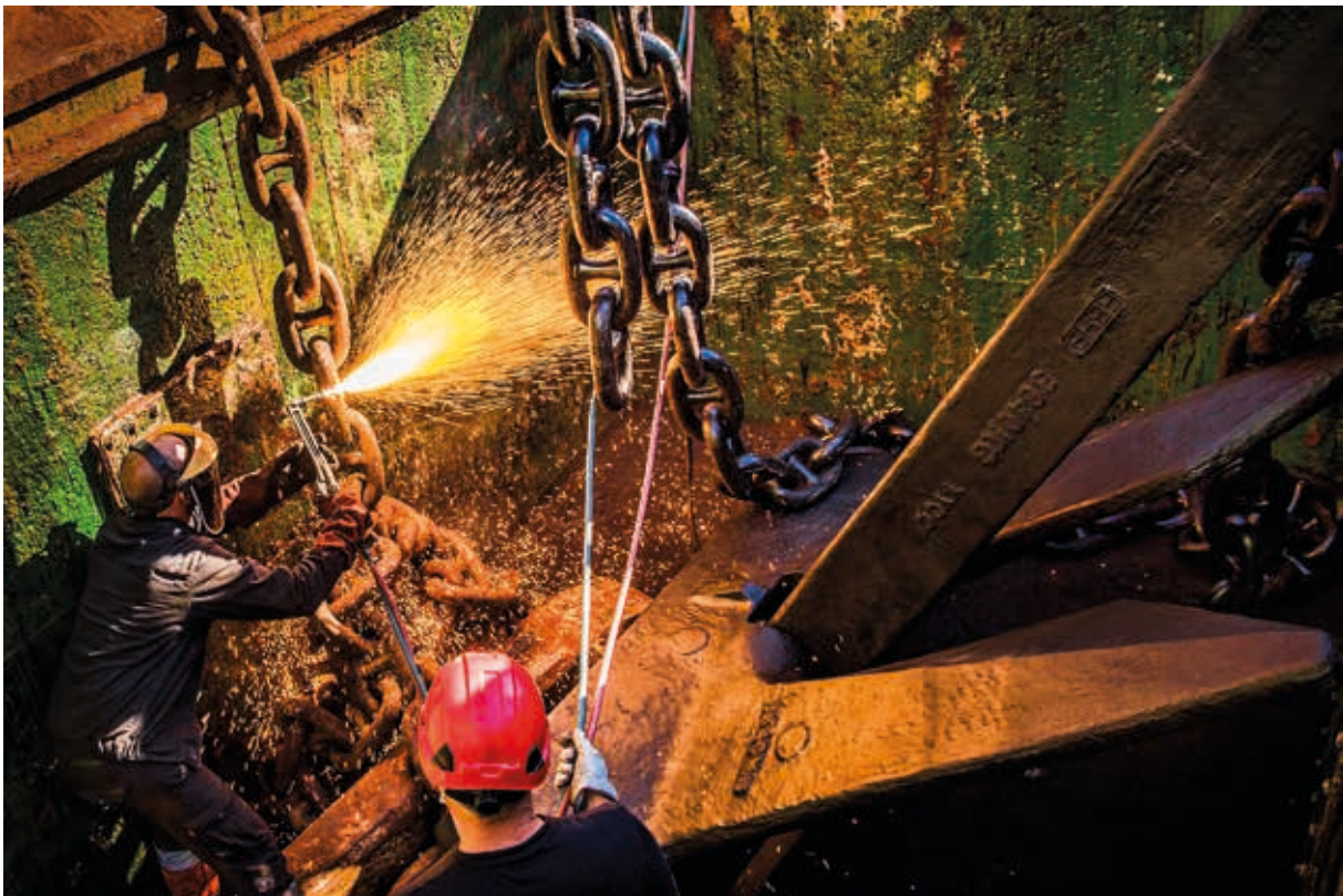
Luces de batalla 28-10-2020