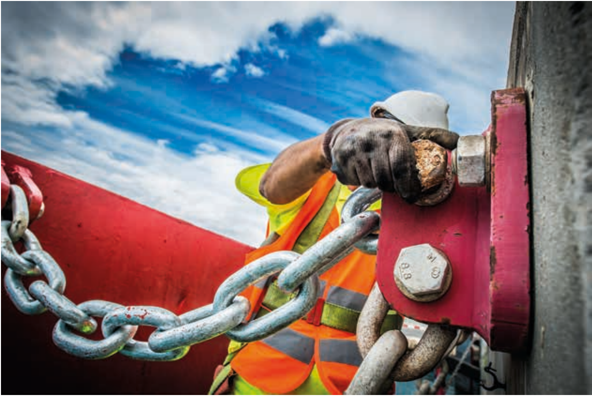
Alianza eterna. 10-05-2017