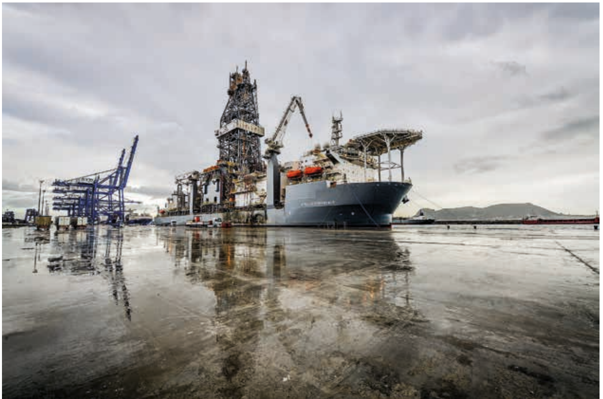
En tierra prometida. 13-10-2016