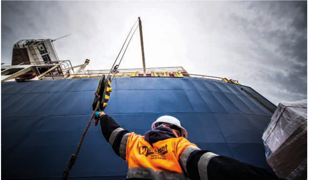
Alimentando al dragón. 11-11-2019