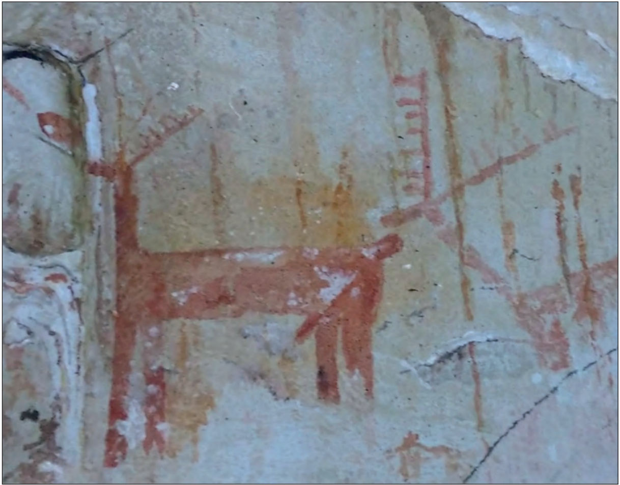
Manuela Puerta. - Fauna cuaternaria. Las Palomas I. Tarifa - 2015