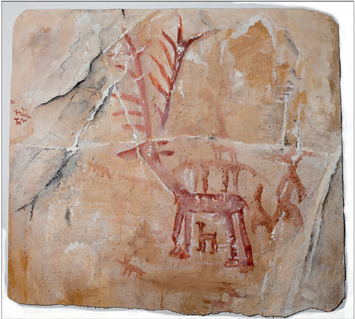
Manuela Puerta. Animales en la Janda. Tajo de Las Figuras. Benalup - 2015