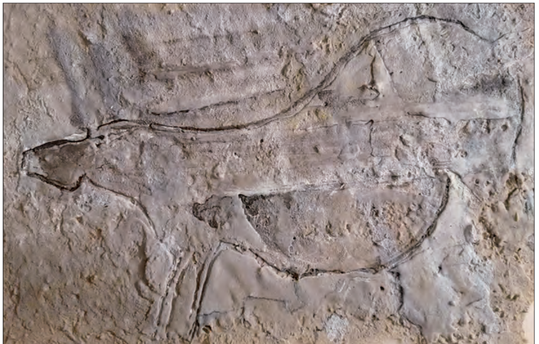
Manuela Puerta. Preñada. Cueva del Moro. Tarifa - 2019