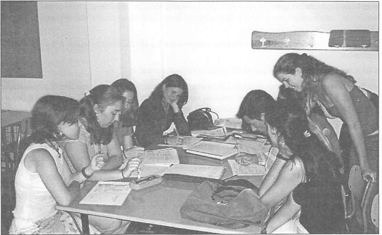
Alumnos de la Escuela Universitaria de La Línea en trabajo de grupo.

[...] la universidad debe promover el desarrollo de los siguientes aspectos: