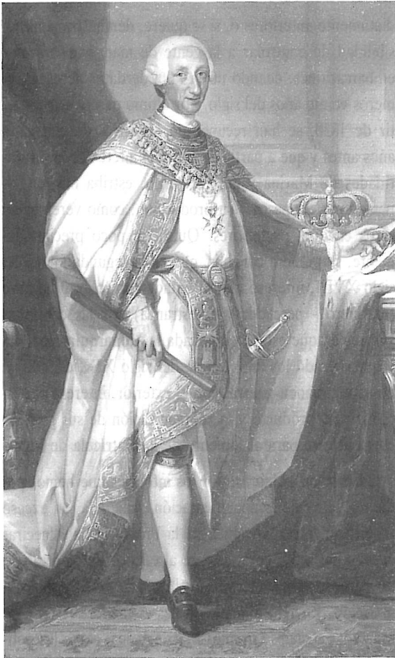
La Matrícula se generalizó en todo el país durante los reinados de Carlos III y Carlos IV.

pretenden salir de noche, poniéndoles desde la tarde antes un guarda que exista a bordo hasta el momento en se que larguen. Para este aumento se trabajo que reciba el Resguardo, dice, que los gremios se ofrecen a contribuir lo que corresponda”.