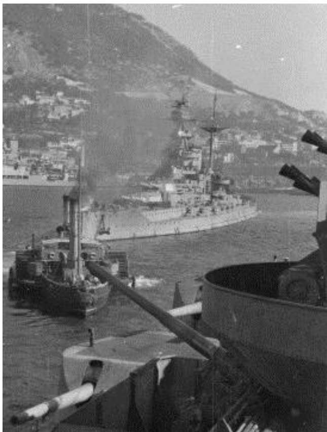
Ilustración nº 1. El acorazado Malaya visto desde el Rodney en 1941 fondeados frente a la Roca.

Varias unidades principales de la Royal Navy formaron parte de la Fuerza H pero, sin lugar a dudas, fueron los portaviones los que tuvieron una importancia tanto táctica como estratégica mucho más relevante que otros buques de gran renombre como el crucero de batalla Hood o los acorazados. Hasta su hundimiento cerca de Gibraltar el 14 de noviembre de 1941 por el impacto de un solo torpedo del submarino alemán U-81 comandado por Friedrich Guggenberger, el portaviones Ark Royal tuvo una carrera operacional destacadísima y decisiva para el desarrollo del conflicto, tanto en el Mediterráneo como en el Atlántico. De él dijo el propio Sommerville al enterarse de su hundimiento: "Era en realidad la guía de la Royal Navy y tal vez el buque más famoso del mundo sólo comparable al Hood ". A pesar de la obsolescencia de las aeronaves de su dotación aérea, sobre todo los biplanos torpederos Fairey Swordfish MK I, la carencia de unidades similares en las flotas alemana e italiana dio a los británicos una ventaja táctica y una capacidad de ataque y escolta de larga distancia de la que carecieron sus enemigos.