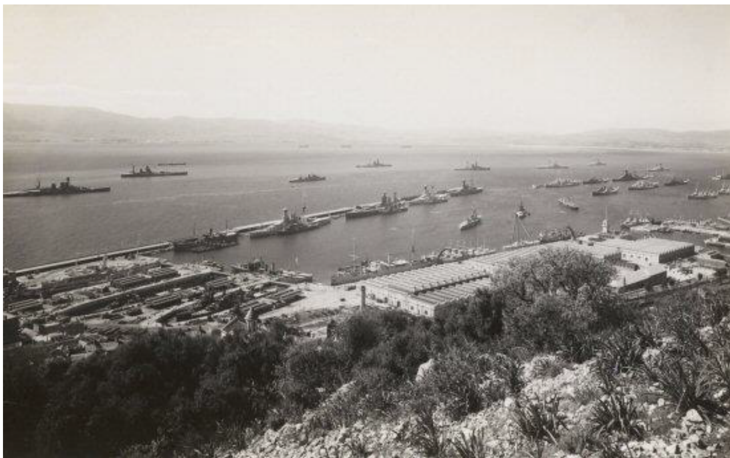
Ilustración nº 2. Concentración de buques de guerra en el puerto de la Roca con los inconfundibles perfiles de los acorazados Rodney y Nelson entre ellos.

Esta implicación empezó a definirse en una reunión celebrada en Berlín el cuatro de noviembre de 1940, donde Hitler con los altos mandos de la Wehrmacht y la Luftwaffe se plantearon las futuras operaciones que más tarde debían concretarse en la conquista de Malta (operación Herkules) y de Gibraltar (operación Félix)