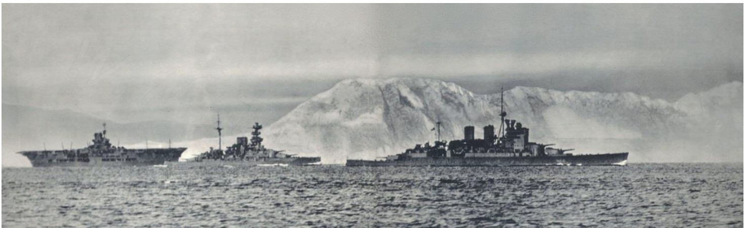
Ilustración nº 3. Unidades de la fuerza H.

La flota surta en Gibraltar habría supuesto un verdadero quebradero de cabeza para el Eje si el intento de su conquista se hubiera llevado a cabo. Los alemanes tuvieron en cuenta las defensas estáticas de la Roca (Informe Mikosch-Canaris en el que se descarta el ataque aerotransportado al Peñón), pero no podían prever que unidades navales la defenderían por lo que tenían planificados dentro de la operación Félix ataques aéreos contra los buques británicos; y viendo la aportación que el fuego de artillería naval hizo en diversas batallas de la guerra como en los desembarcos de Salerno, Anzio o Normandía, contra formaciones militares no protegidas sólo la superioridad aérea total habría hecho posible la citada operación.