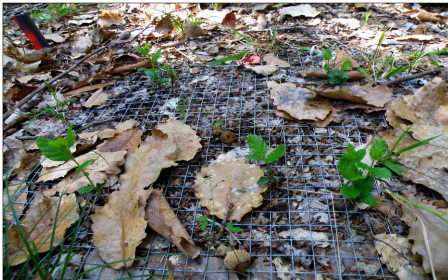
Figura 3. Plántulas emergidas en las mallas de siembra.

con alcornoque = 2646 bellotas de alcornoque; 9 semillas x 49 puntos x 3 parcelas con quejigo = 1323 bellotas de quejigo). Las semillas se sembraron con una separación de 10 cm y se protegieron con una malla de luz 1 cm para prevenir el ataque de roedores (figura 3).