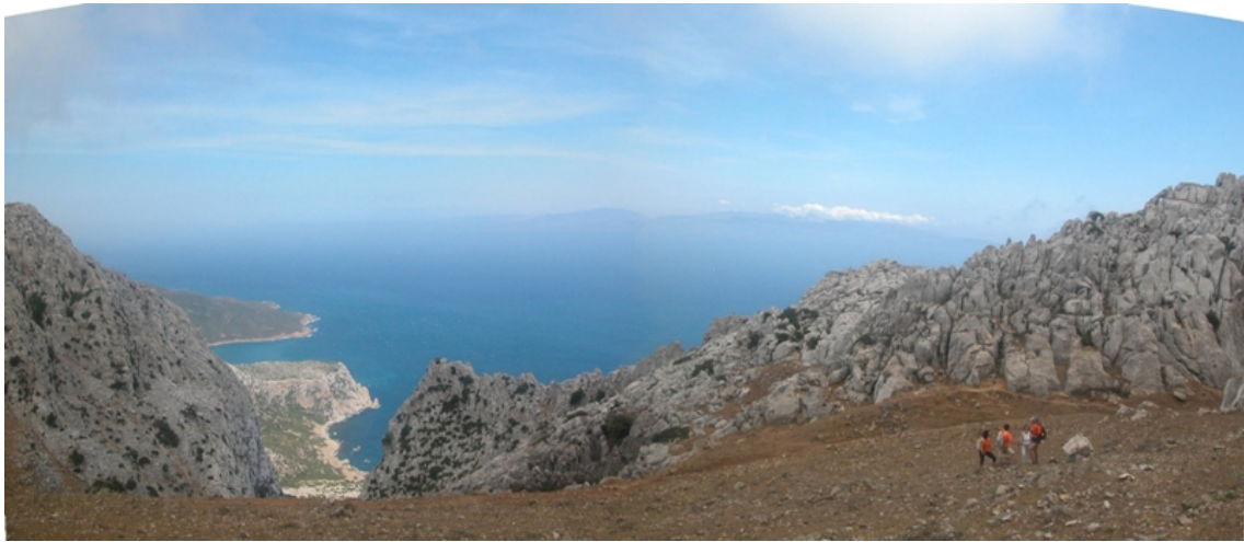
Figura 4.- Vista del Estrecho desde el Djebel Musa.

Digno de mención es la referencia que hace en 112 a la existencia de grandes escollos que se extienden desde el cabo Espartel en dirección norte (απο δε της Ερμιαιας ακρας ερματα τεταται μεγαλα) 9 lo cual denota la naturaleza marinera del relato.