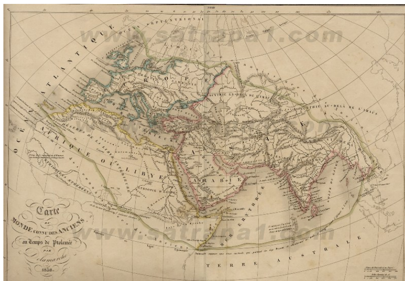
Figura 2.- Mapa del mundo conocido por los antiguos de Delamarche 1845.

Todos estos relatos vienen adornados por una serie de informaciones relativas a seres fabulosos y hechos extraordinarios que dotan al relato de un componente bastante atractivo. La paradoxografía se basa en esto; ahora bien, ello no comporta la negación de la realidad. El pescador que llega a su casa contando que se le escapó un pez de cinco kilos no está mintiendo; quizás esté exagerando un hecho real. La labor del historiador es quitar la exageración a estos textos pero no debemos negarles su validez histórica por parecernos fabulosos.