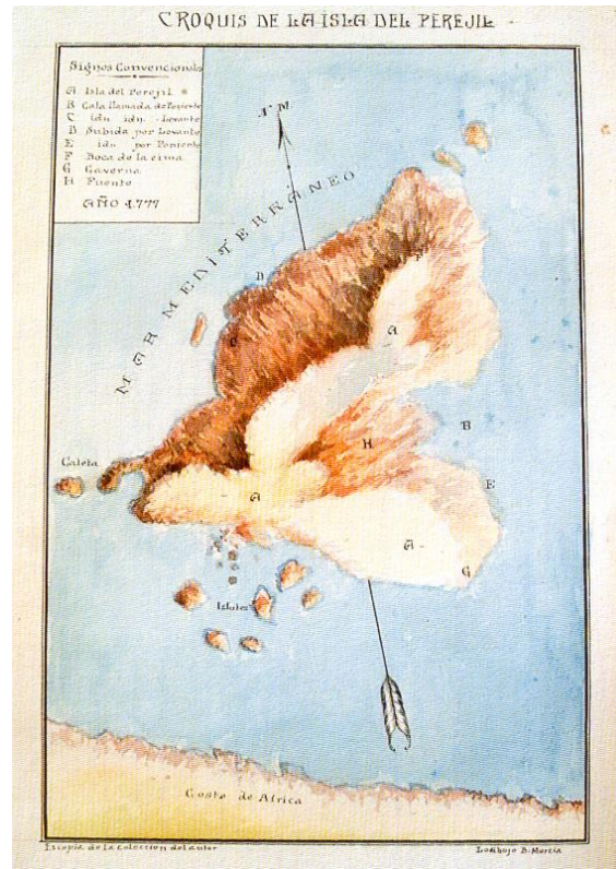
Figura 4.- Plano de la Ysla del Perejil situada en el estrecho de Gibraltar cerca de la costa de África por F. de paz (1771)

Justo frente a ella se sitúa el Djebel Musa, con sus imponentes 865 metros convirtiéndose en la altura más destacada del Estrecho (la columna líbica para Escilax) y la ciudad frente al río que no puede ser más que la Thymiat-eria del Periplus 112 (LÓPEZ PARDO, F., 2005:568), esto es, la actual ciudad de Tánger. Como vemos, el navegante cario hace una descripción geográfica bastante acorde con la realidad del momento: un accidente geográfico que llama poderosamente la atención (Abila), una isla pequeña y no habitable (Perejil) y una ciudad (Tánger) con su río el Oued Souani.