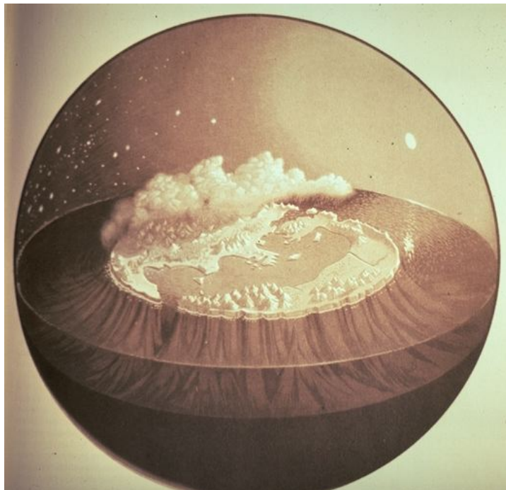
Figura 3.- Representación cartográfica del mundo en la Antigüedad.

En un cosmos así, es fácil imaginar un mundo circular pues a nadie escapa que un centro en un círculo parece más centro que en otra forma geométrica. Imaginar pues un mundo con forma de disco plano es más que lógico para las sociedades antiguas. Sin embargo, si este mundo está rodeado de un río con sus límites, parece haber una cierta predisposición a cruzar dichos límites.