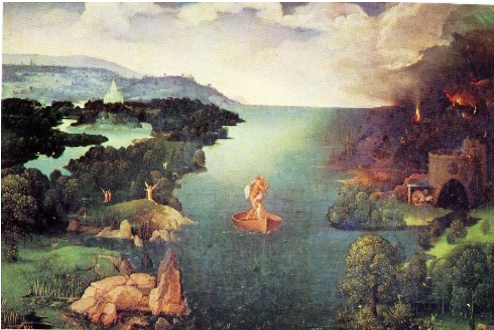
Figura 1.- El paso de la Laguna Estigia por Joachim Patinir (Museo del Prado)

La periégesis de Hecateo de Mileto se nos presenta como el compendio geográfico más importante del periodo arcaico. Así, por periégesis debemos entender una descripción de la tierra con vocación ecuménica.