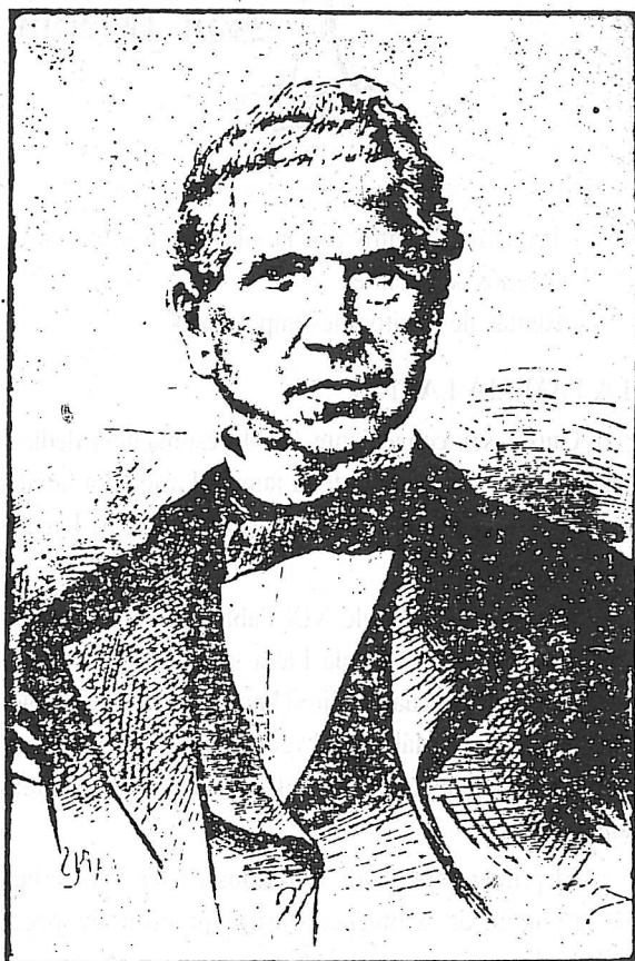
Martín Larios. Primer Marqués de Larios.

Martín Larios fue nombrado primer Marqués de