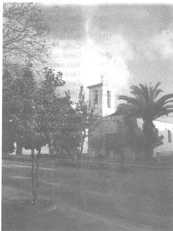
Calle Real. San Pablo de Buceite.

Las Colonias de Buceite y Tesorillo se incorporan con todas sus fincas, construcciones y equipamientos a la nueva Sociedad que se constituye en 1887.