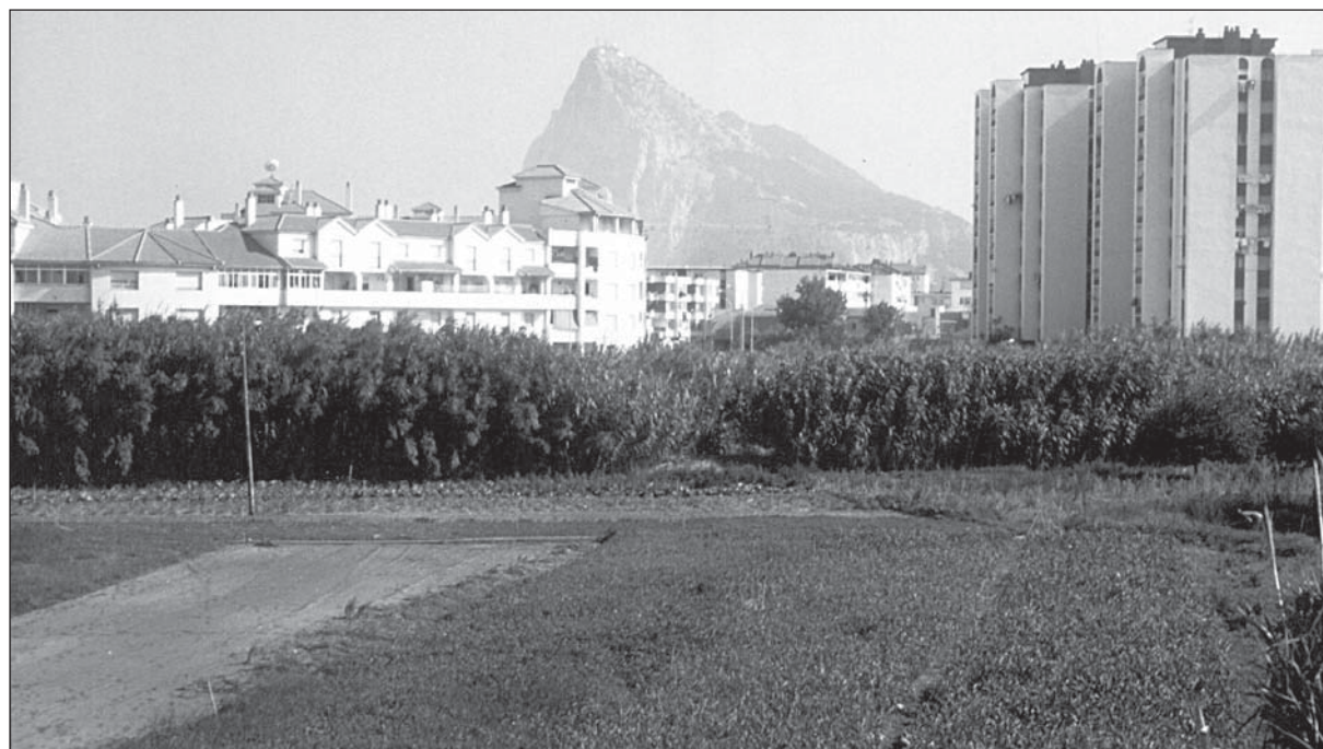
Figura 2. Panorámica parcial de la zona de estudio. Se observan en primer plano la zona cultivada y el cañaveral.