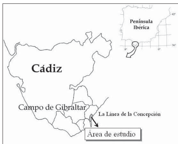
Figura 1. Localización del Campo de Gibraltar en la península Ibérica y del área de estudio en La Línea de la Concepción.

El área de estudio se conoce localmente como huerto Manilva, tiene una superficie de casi 1,4ha y se encuentra localizada en el límite norte del casco urbano de La Línea de la Concepción (figura 2). Hasta la finalización del periodo de estudio estaba formada por tres hábitats diferenciados que, por otro lado, se hallan representados en la mayoría de los huertos de la zona. Estos hábitats son: la zona cultivada, la zona baldía y el cañaveral. La zona dedicada al cultivo es, generalmente, la más típica y amplia de los huertos. En la parcela de estudio ocupaba unas 0,72ha, todos los productos se cultivaban al aire libre, eran herbáceos y pertenecían a la modalidad de regadío, lo cual permitía a la fauna que vivía en cualquiera de los tres hábitats contar con agua durante todo el año. Las hortalizas y verduras más cultivadas, dependiendo de la estación del año, son: el puerro, el perejil, la hierbabuena, el apio, el nabo y la zanahoria y en menor proporción la acelga, la mejorana, el rábano, el tomate, la patata y la judía verde. La zona baldía, con una extensión de 0,33ha en el huerto Manilva, no es más que la degradación de la zona cultivada tras su abandono. Está