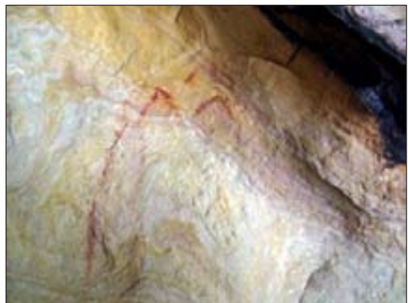
Figura 3. Antropomorfo oculado del abrigo de Las Marianas.