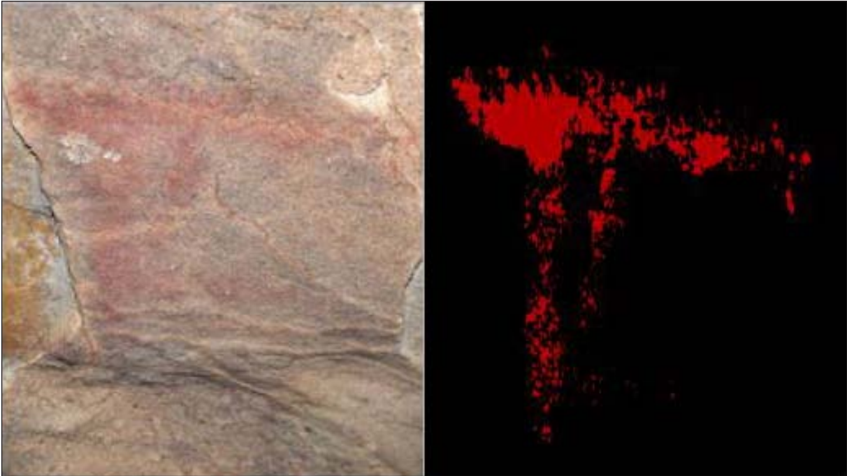
Figura 5. Signo del abrigo de El Peñón.

al. , 2002) se ha detectado la existencia de núcleos poblacionales correspondientes al III er y II o milenios que por su ubicación, muy cercana a la costa, parecen tener una base económica fundamentada en actividades de pesca y marisqueo como son los poblados de Caños de Meca, Trafalgar y Zahora (BERNABÉ, A., 1990 y RAMOS, J. et al. , 2002).