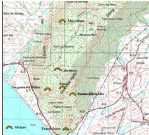
Figura 1. Mapa de la Sierra del Retín con la ubicación de los abrigos rupestres.

Tomaselli (1976) indica como después del último período glacial hubo un clima húmedo muy favorable a la formación de los bosques mediterráneos, al mismo tiempo que, a partir del Neolítico, las sociedades humanas ejercieron una fuerte influencia sobre el medio.