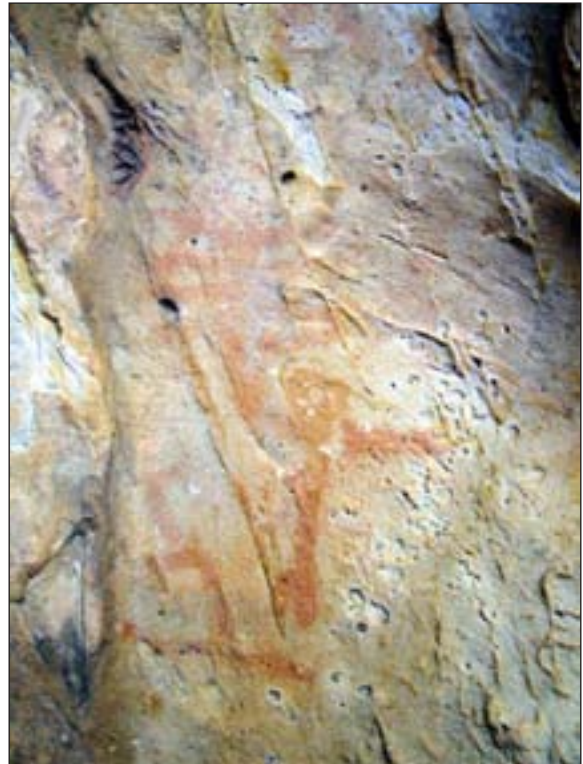
Figura 2. Antropomorfo del abrigo de la Fuente Santa.

En conclusión, de todos los elementos analizados podemos extraer que no hay elemento diferenciador aparente para elegir los abrigos a pintar, ni la altitud, ni la forma o tamaño, ni la orientación. Tan sólo podríamos aventurarnos a indicar su gran visibilidad y su proximidad al agua como aspectos comunes entre ellos.