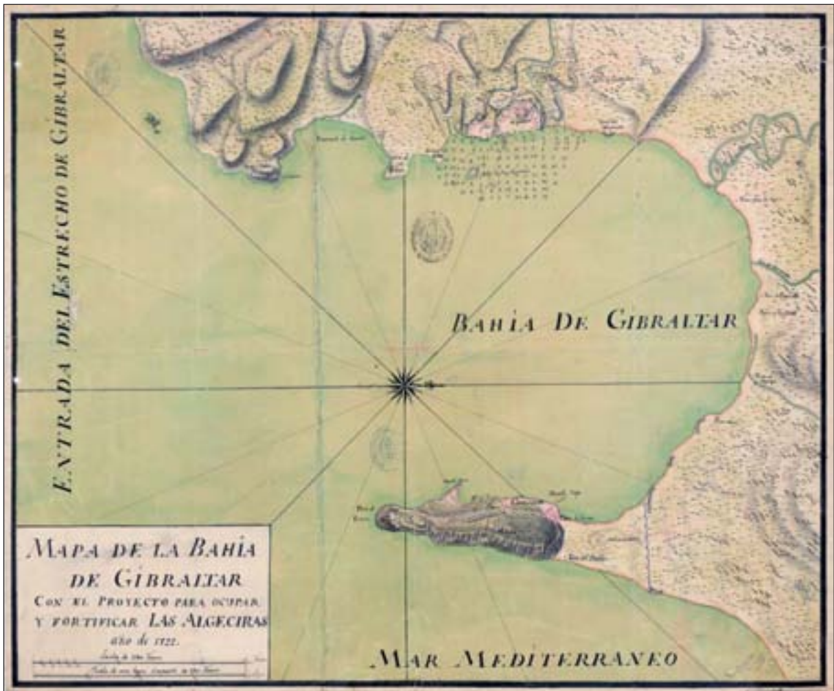
Figura 1. Mapa de la Bahía de Gibraltar y el proyecto para ocupar y fortificar Algeciras. Cuerpo de Ingenieros del Ejército, año 1722. (Nº Inv. 971. E:1/29.000.).