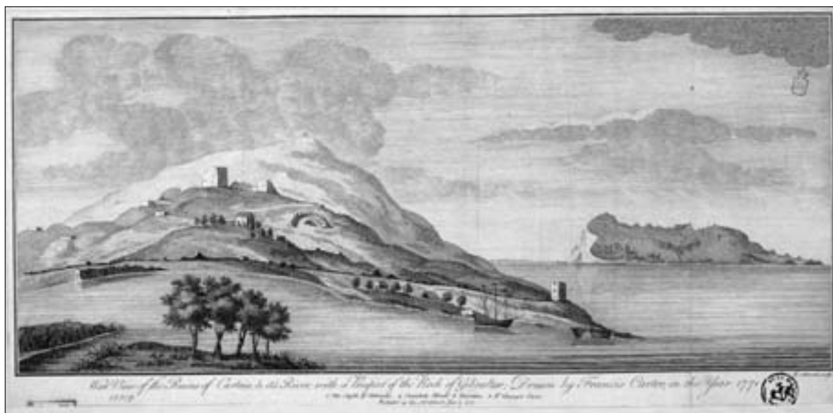
Figura 2. West View of the Ruins of Carteia and its River, with a Prospect of the Rock of Gibraltar , grabado de F. Carter. Londres, 1777.

lucrativo de poder redactar los conocidos hoy como “libros de viaje”. Valga en este sentido, como representativo ejemplo, el Manual 4 que R. Ford publicó en Inglaterra tras su estancia en España.