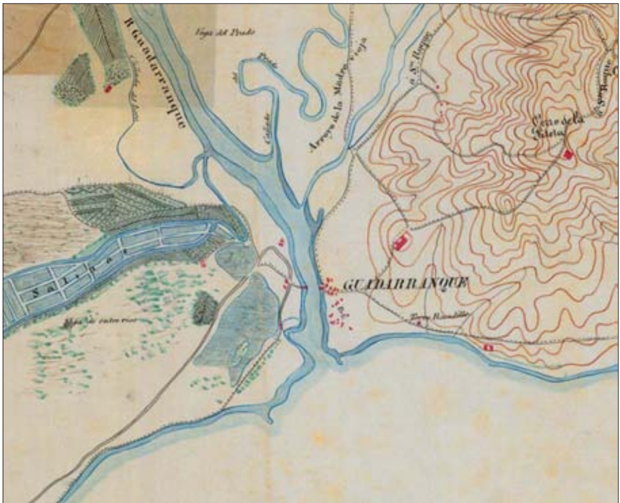
Figura 5. Plano de la Bahía de Gibraltar y su litoral a una legua, (detalle). Cuerpo de Ingenieros del Ejército, años 1857-60. (Nº Inv. 1016, hoja 5. E: 1/10.000. © Centro Geográfico del Ejército, Madrid).