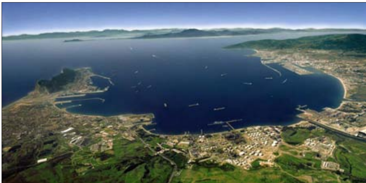
Figura 3. Vista actual, aérea, de la Bahía de Gibraltar.

1939 toma el relevo el Servicio Geográfico del Ejército, perteneciente al Estado Mayor Central, que desde entonces se ha dedicado a elaborar y publicar de nuevo toda la cartografía militar, aplicando las novedades técnicas y metodológicas de cada momento, como son hoy día la formación de modelos digitales de elevación del terreno o la fotogrametría.