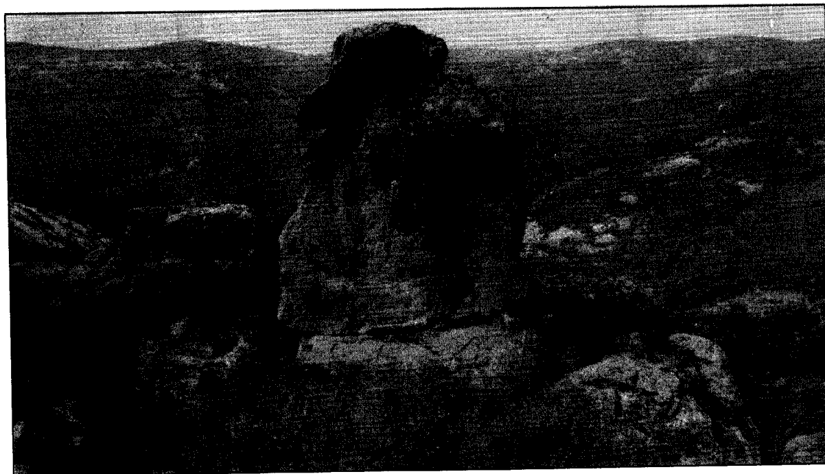
Figura 2. El Baño de la Reina Mora. Las hornacinas.